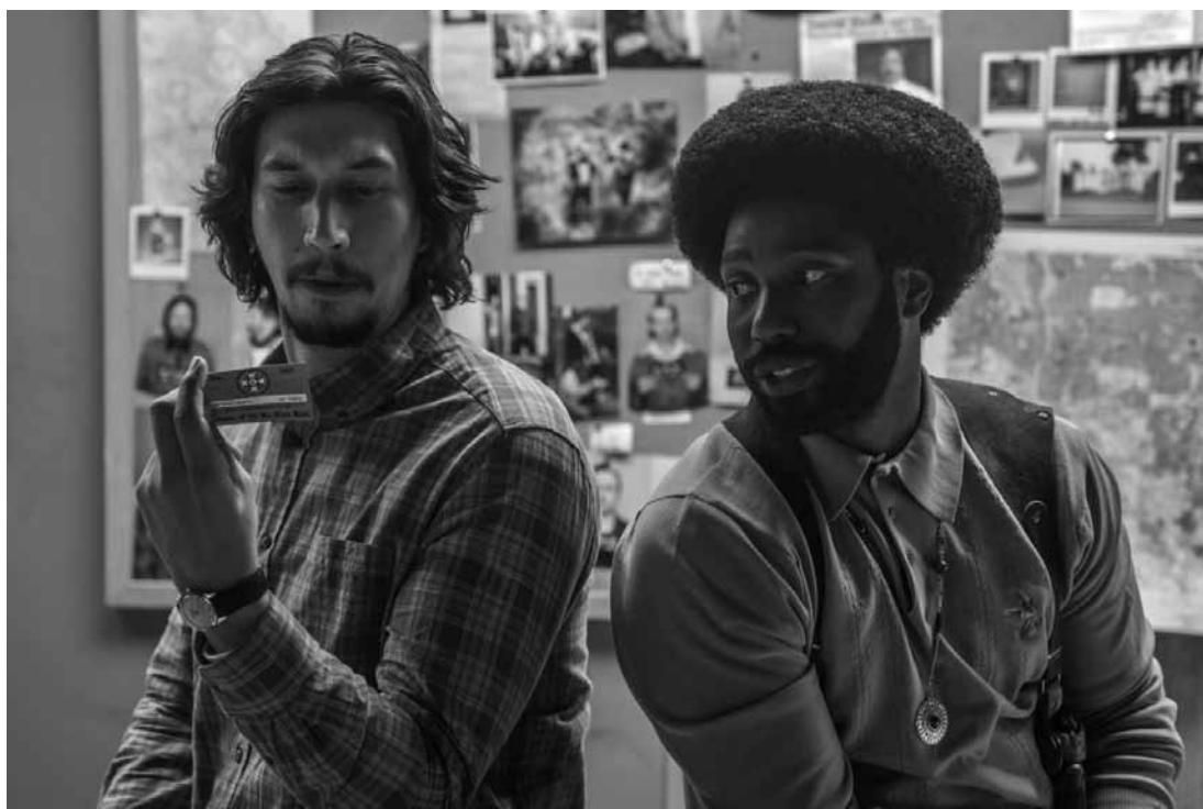
Gemeinsam gelingt es Flip und Ron, den Ku Klux Klan zu infiltrieren.