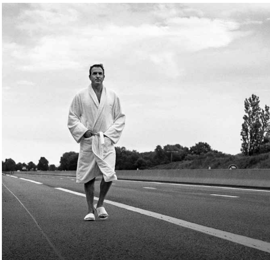
Cette fois, le duo infernal Gustave Kervern et Benoît Delépine laisse clasher Jean Dujardin et Yolande Moreau dans « I Feel Good » - nouveau à l'Utopia.

sie vor den Annäherungen des Machos Benno zu beschützen.