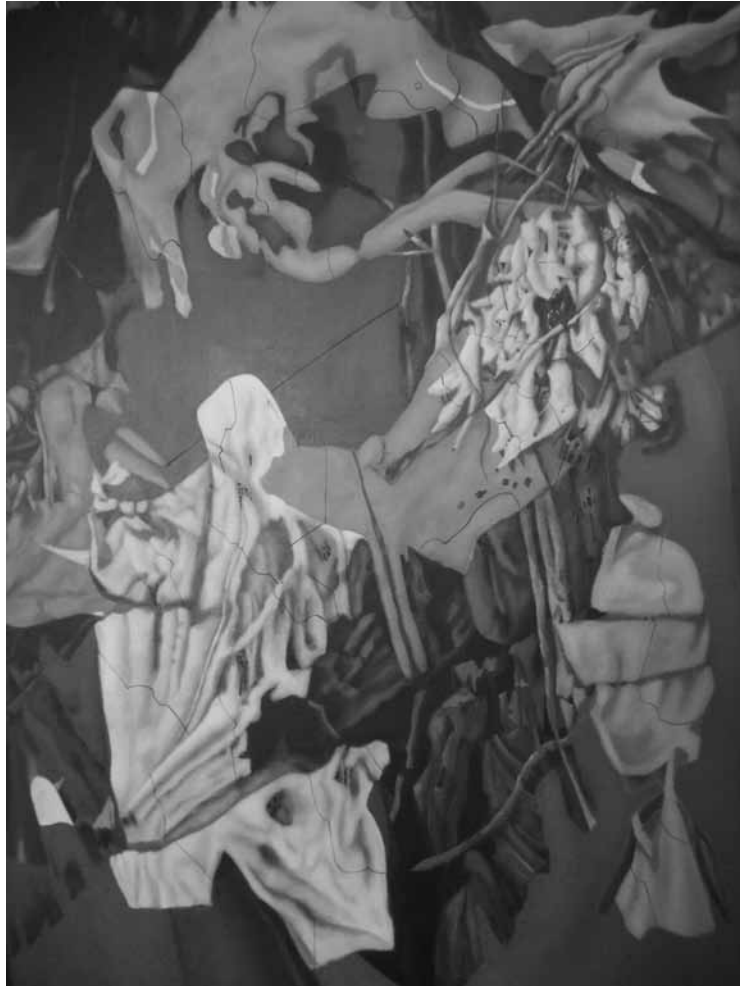
Extrait de la série « Look at the Infinity », 2008.

Dans la chapelle de Neimënster, jusqu'au 7 octobre.