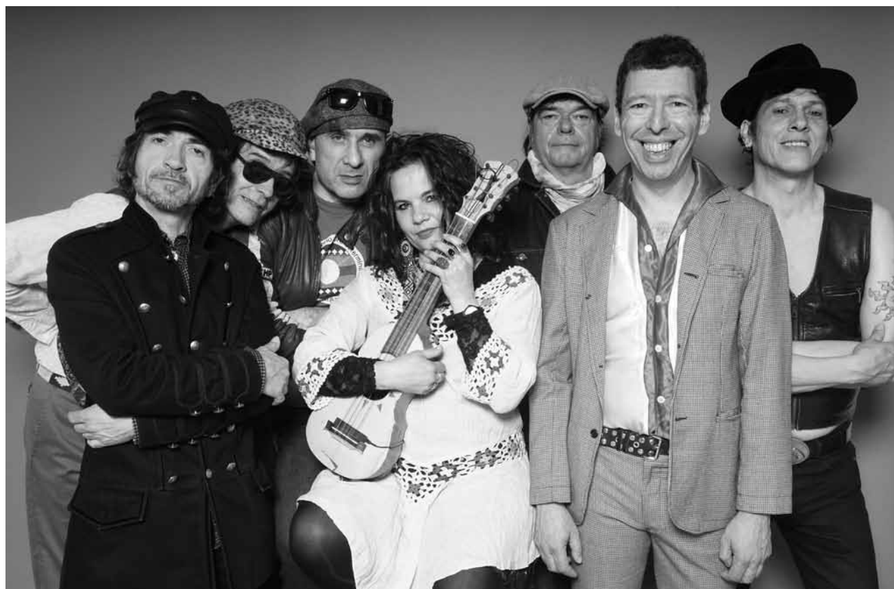
Flor del Fango est un ensemble hétéroclite comprenant des membres de Parabellum, Chihuahua et de Mano negra - ils feront vibrer le Gueulard à Nilvange ce samedi 24 novembre.

Opus 78 feat. Felice Civitareale , big band, centre culturel Aalt Stadhaus, Differdange, 20h. Tél. 58 77 1-19 00. www.stadhaus.lu