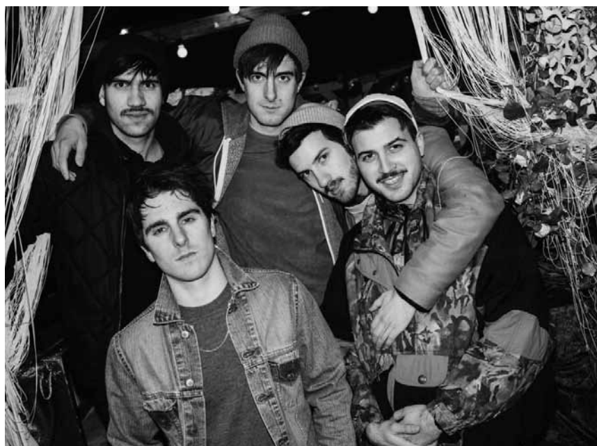
Noch keine ganz großen Sterne, aber dafür haben die Leoniden den tanzbaren Indie-Pop offenbar mit Löffeln gefressen – am 28. November in den Rotondes.