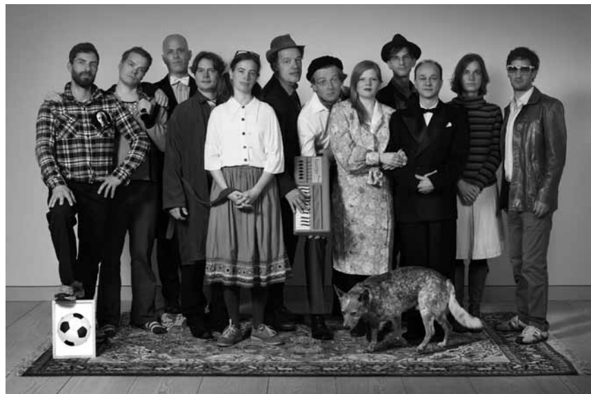
L'ensemble mosaik revisite les instruments synthétiques des années 1970 et 1980 à sa façon - ce vendredi 23 novembre à la Philharmonie, dans le cadre du festival Rainy Days.