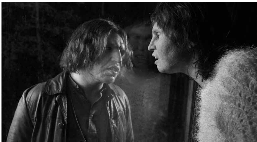
Une rencontre prodigieuse entre deux êtres pas comme les autres.