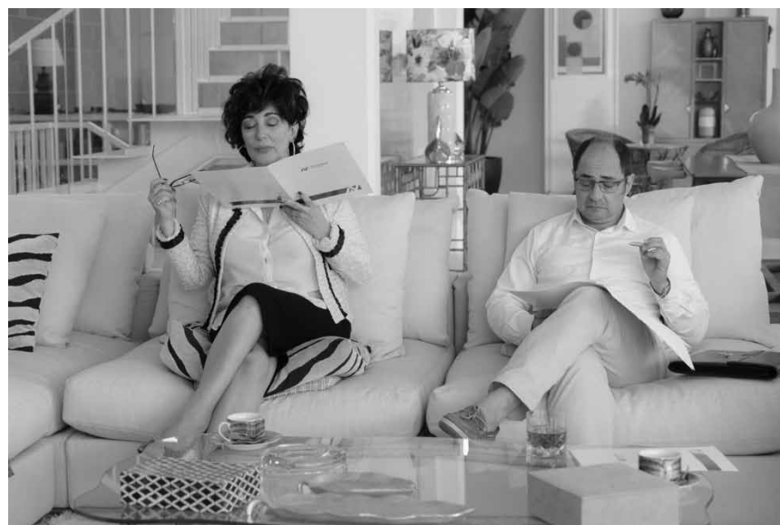
Un papa fauché, coincé dans une promesse intenable, va devoir trouver une solution : « El mejor verano de mi vida » - à l'Utopia les 2 et 4 février.