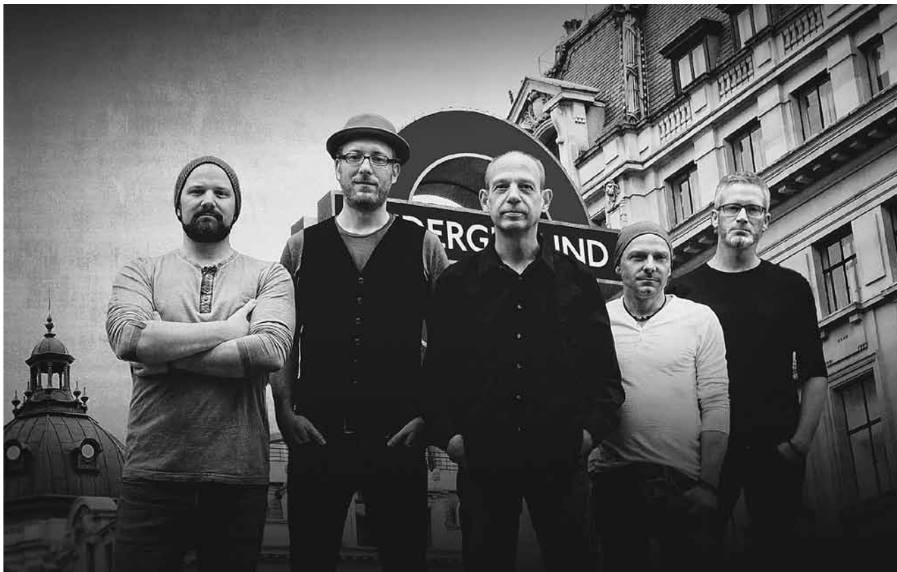
Brothers in Arms lassen am 21. Februar im Duksaal die Musik der Dire Straits wieder aufleben.

WAT ASS LASS | 14.02. - 23.02. / ANNONCE