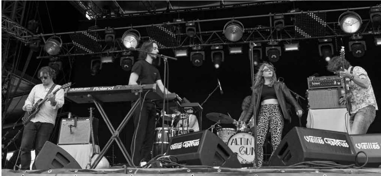
Altin Gün im Konzert beim „Festival des vieilles charrues“ in 2018.