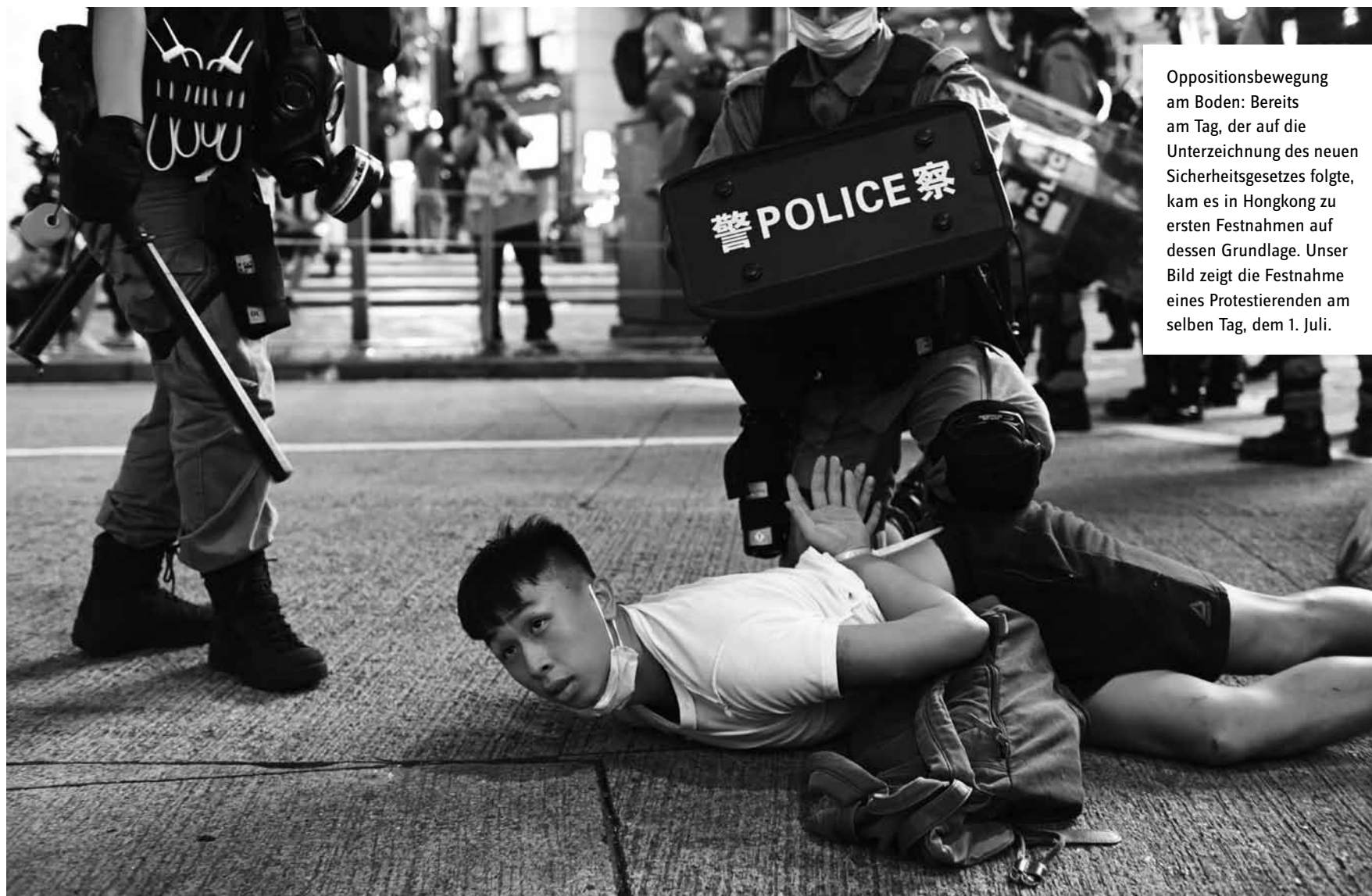
Oppositionsbewegung am Boden: Bereits am Tag, der auf die Unterzeichnung des neuen Sicherheitsgesetzes folgte, kam es in Hongkong zu ersten Festnahmen auf dessen Grundlage. Unser Bild zeigt die Festnahme eines Protestierenden am selben Tag, dem 1. Juli.