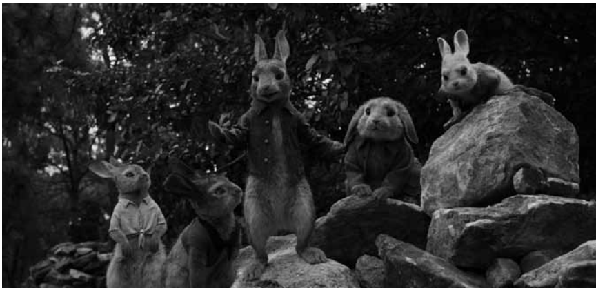
Wer kennt ihn nicht? Lange Ohren, blaue Jacke und keine Hose: „Peter Hase“. Das furchtlose Langohr ist wieder im Kinepolis Kirchberg zu sehen.

Zusammen mit den Menschen lebten Drachen einst in harmonischem Einklang. Doch als eine böse Macht ihre Welt bedrohte, opferten sich die Drachen, um die Menschheit zu retten. 500 Jahre später kehrt die alte Bedrohung zurück, doch nun gibt es keine Drachen mehr. Die junge