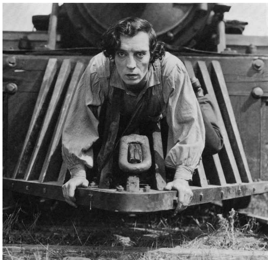
Johnnie Gray aime sa fiancée et sa locomotive. Son aventure commence quand les deux sont enlevées. « The General », ce dimanche 25 avril à 15h à la Cinémathèque.

Filmé dans un grand lycée urbain de Philadelphie, le documentaire montre comment le système scolaire ne transmet pas seulement des « faits »,