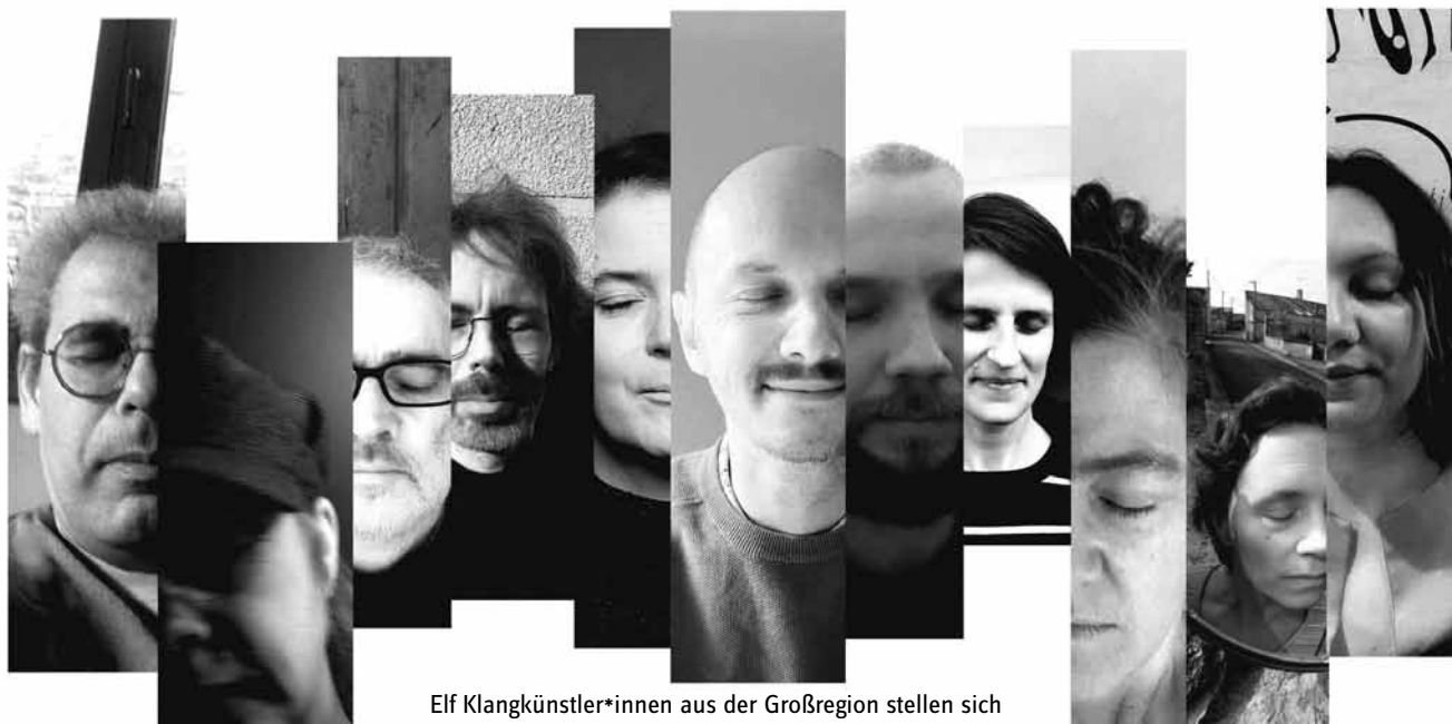
Elf Klangkünstler*innen aus der Großregion stellen sich an zwei Abenden in Luxemburg und Saarbrücken vor.

An beiden Abenden werden im Anschluss an die Performances die elf Radiokünstler*innen sich und ihre Arbeiten dem Publikum vorstellen. Dabei gibt es nochmal was auf die Ohren: Mit kurzen Hörstücken wird das Repertoire der Radiom-Mitglieder präsentiert. Auch hier werden Dolmetscher*innen dafür sorgen, dass