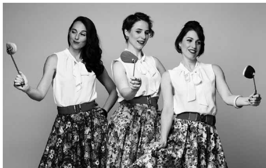
Chez les Nanas dans l'réto tout est rétro : les jupes, la coiffure et les chansons françaises. À l'Artikuss, le 5 juin à 20 h.