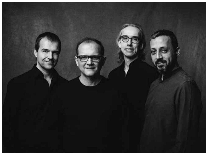
Wird am 21. September für Jazz in der Philharmonie sorgen: Das Anouar Brahem Quartet steigt dort um 20 Uhr auf die Bühne.