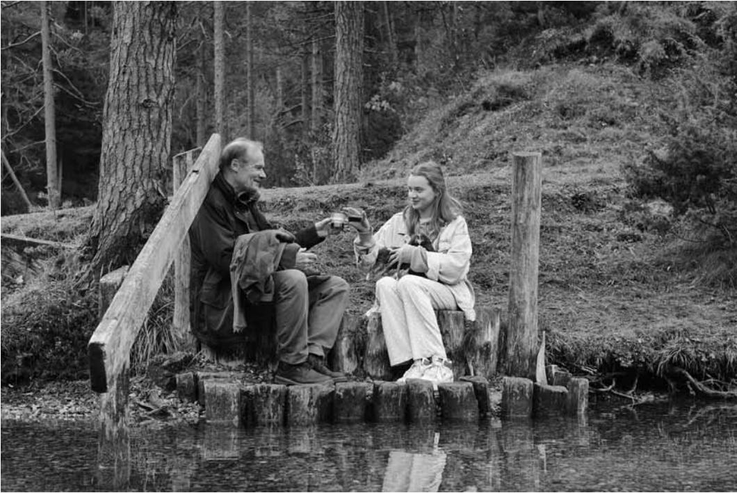
Nach dem Tod ihres Bruders findet Paula neuen Lebensmut durch eine Reise und eine unerwartete Freundschaft. Im Kinepolis Belval, Kinoler, Kulturhuef Kino, Kursaal, Orion, Prabbeli, Scala, Starlight, Sura, Utopia und Waasserhaus.

LUXEMBOURG Laterna Magica projet audiovisuel, square Jan Palach, jusqu'au 27.10. en permanence.