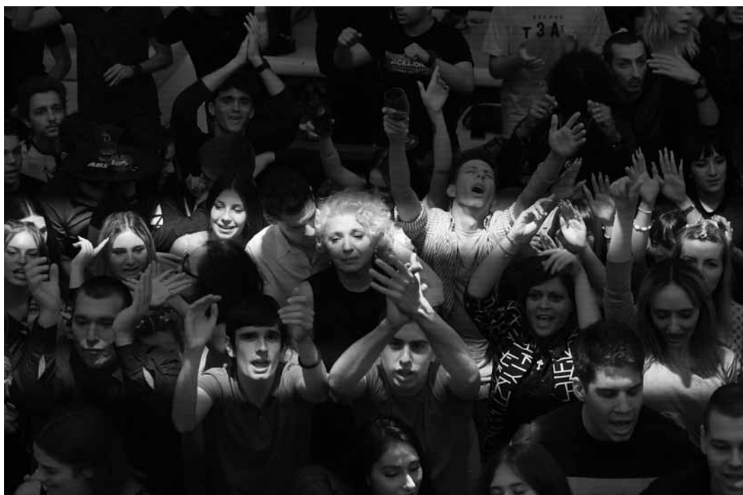
In „Mother Mara“ zerbricht das Leben einer Mutter durch den plötzlichen Tod ihres Sohnes. Im Kinopolis Belval und im Utopia.