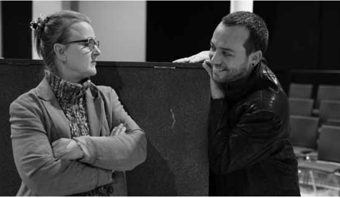
Am Donnerstag, dem 5. Dezember, um 19:30 Uhr beleuchtet Fatma Aydemir im Theater Trier mit „Doktormutter Faust“ – einer feministischen Neuinterpretation von Goethes Klassiker – Macht, Populismus und Missbrauch im heutigen Kontext.

Moments avec des compositrices luxembourgeoises , table ronde