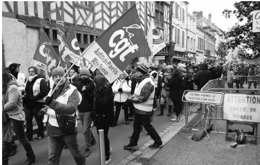
La CSI s'inquiète de la répression dont font l'objet les syndicalistes en France, où plus de 1.000 membres de la CGT ont été poursuivis lors des manifestations contre la réforme des retraites.

Sur le plan géographique, le Moyen-Orient et l'Afrique du Nord demeurent « la pire région pour les droits des travailleurs », note la CSI. Bien que l'Europe « reste la région la moins répressive pour les travailleurs, une détérioration constante a été observée au cours des quatre dernières années », déplore l'étude. La note moyenne du continent en 2025 est de 2,78 sur 5, contre 2,73 l'année précédente (plus le score est élevé, plus la situation est mauvaise). « Quasiment trois quarts des pays européens ont violé le droit de grève et près d'un tiers d'entre eux ont arrêté ou dé-