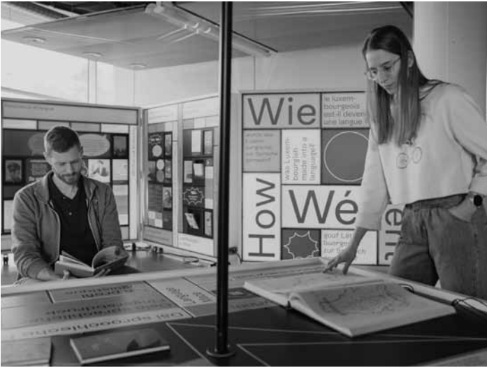
L'exposition « Langue(s) luxembourgeoise(s) » invite à explorer la ou les langues du pays. À voir jusqu'au 30 juillet au Lëtzebuerg City Museum.

Marc Aurel. Kaiser, Feldherr, Philosoph Rheinisches Landesmuseum Trier (Weimarer Allee 1. Tel. 0049 651 97 74-0), vom 15.6. bis zum 23.11., Di. - So. 10h - 17h.