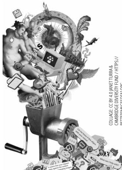
KI funktioniert wie ein Fleischwolf: Informationen gehen rein, eine etwas unappetitliche Paste kommt unten raus.

Zwischen den Zeilen lässt sich in der Fedil-Studie ein gewisses Erstaunen darüber herauslesen, dass manche Firmen es wagen, sich nicht näher mit generativer KI zu beschäftigen oder beschlossen haben, diese nicht einzusetzen. Da Werkzeuge jedoch selten nur um ihrer selbst Willen genutzt werden, stellt sich die Frage, wozu die Industrie generative KI braucht. Das Papier der Fedil listet sieben Bereiche auf, die sich jedoch auf den Einsatz von „Chatbots“ beschränken. Chatbots wie „Microsoft Copilot“ sollen als „persönliche Assistenten“ für Mitarbeiter*innen dienen, Chatbots sollen Kund*innenservice durchführen, Chatbots sollen sich um interne und externe Kommunikation kümmern und „Ideen und Lösungen generieren“. Da passt es auch gut ins Bild, dass 72 Prozent der Firmen Lösungen „von der Stange“ nutzt – also Produkte mit bekannten Namen wie ChatGPT, Copilot oder „Claude“. Die Hälfte setzt laut Fedil-Studie aber auch angepasste KI-Produkte ein: entweder Eigenentwicklungen (49 Prozent) oder Produkte externer Entwickler*innen (28 Prozent). Dadurch, dass vor allem Microsoft dazu übergegangen ist seinen Chatbot in quasi all seine Produkte einzubauen, wird es immer schwieriger, dem zu entkommen. Nachdem