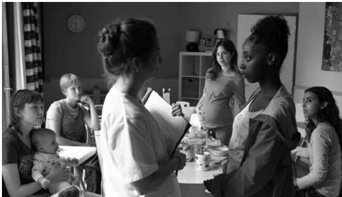
« Jeunes mères » : cinq adolescentes qui nourrissent l'espoir d'une vie meilleure pour elles-mêmes et pour leur enfants. Nouveau dans presque toutes les salles.

Star Trek II: The Wrath of Khan USA 1982 von Nicolas Meyer. Mit William Shatner, Leonard Nimoy und DeForest Kelley. 113'. O.-Ton + fr. Ut. Sa. 7.6., 16h. Die wilden Zeiten von Captain Kirk, „Pille“ McCoy und Spock scheinen vorbei zu sein. Anstatt sich durchs Weltall zu kämpfen, feiern sie auf der Erde den Geburtstag des Captains. Währenddessen ist Pavel Chekov als Erster Offizier der Reliant auf dem Weg ins Ceti-Alpha-System. Doch der vermeint-