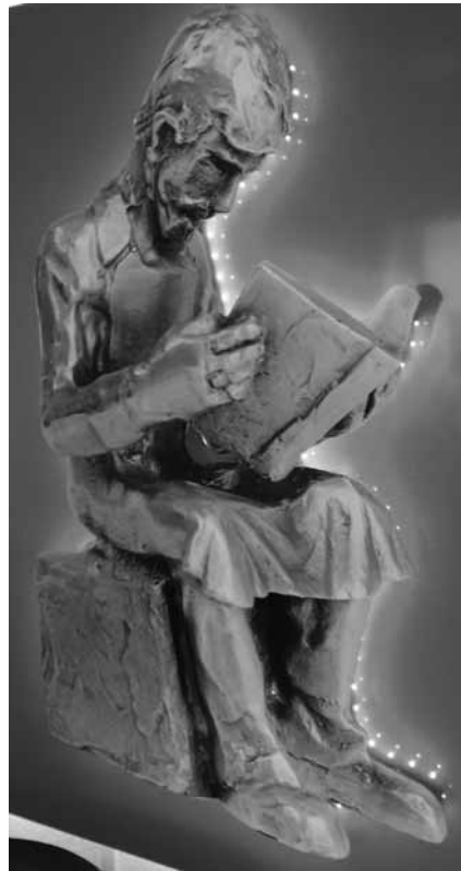
Eine Tradition unter den Zigarrenmachern: Vielerorts wurde zur Unterhaltung und Weiterbildung während der Arbeit ein Vorleser bestimmt. Die deutsche Gewerkschaft NGG bezieht sich auf ihn als Symbol.

Gott, was bin ich froh, dass meine Hühner anders sind. So bleibt der Hühnerstall mein Rückzugsort, um dem Einerlei der eindimensionalen Zweibeiner zu entkommen und in einem Meer analoger Ruhe abzutauchen. Hier ermöglicht die Welt tatsächlich die aus Yoga- und Achtsamkeitsseminaren bekannte Entspannung und versorgt mich mit Energieströmen, von denen andere nur träumen können.