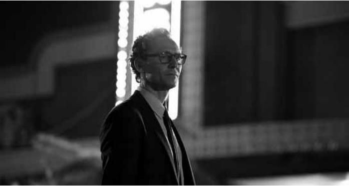
„The Life of Chuck“ erzählt chronologisch rückwärts vom Leben eines gewöhnlichen Mannes, beginnend mit dessen Tod. Neu in fast allen Sälen.

Suite à une erreur de réservation, deux familles que tout oppose, ainsi qu'un éditeur un peu snob et l'influenceuse qu'il souhaite publier, se retrouvent contraints de partager une sublime maison de vacances. Le choc des cultures est immédiat, entre habitudes incompatibles et personnalités affirmées. Pourtant, malgré les tensions et quiproquos, ces vacances forcées prennent une tournure inattendue.