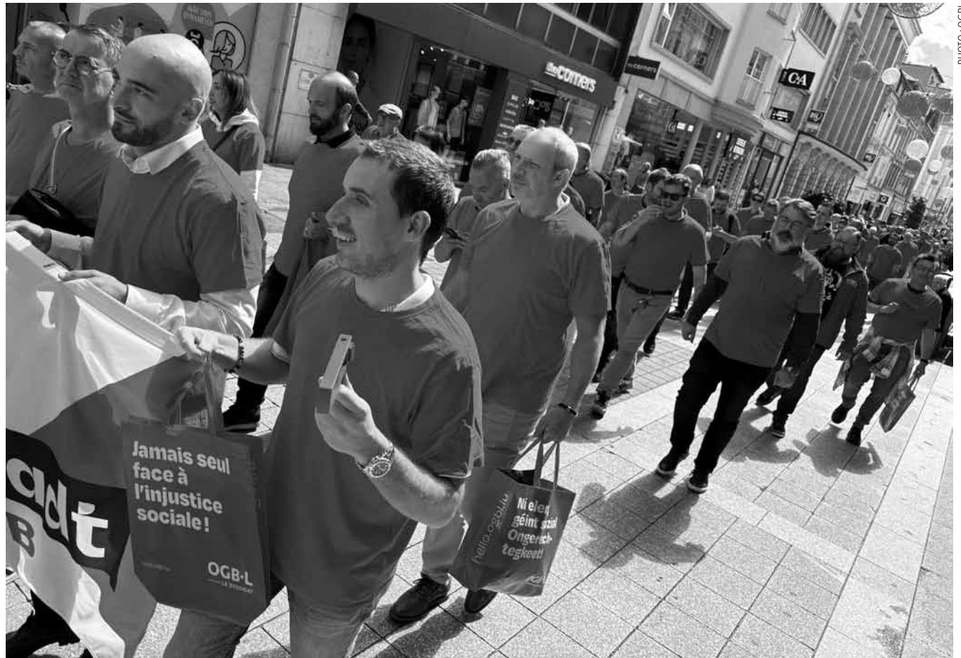
Les délégués détachés de l'OGBL défilent dans les rues d'Esch-sur-Alzette, le 6 juin, pour promouvoir la manifestation prévue en fin de mois.

Der Weg zur Transparenz war für das Zug lang und steinig und offenbart am Ende ein tieferliegendes Problem, weswegen die Organisation jetzt auch einen Transparenzfonds angekündigt hat. Der soll Journalist*innen und NGOs helfen, ihr Recht auf die Freigabe von Dokumenten durchzusetzen, wenn sich wieder einmal eine Verwaltung querstellt. Doch es scheint, als sei der Weg zu einer Mobilitätswende – oder zumindest der Sicherheit aller Verkehrsteilnehmer*innen, noch länger und steiniger. Trotzdem will das Zug auch hier weitermachen: Im Sommer soll eine neue Runde des „safe crossings“-Projekt unter safecrossing.app starten. Wieder sollen Freiwillige mittels Crowdsourcing Zebrastreifen analysieren – diesmal nicht nur in der Hauptstadt, sondern auch in Esch/Alzette, Echternach und weiteren Städten.