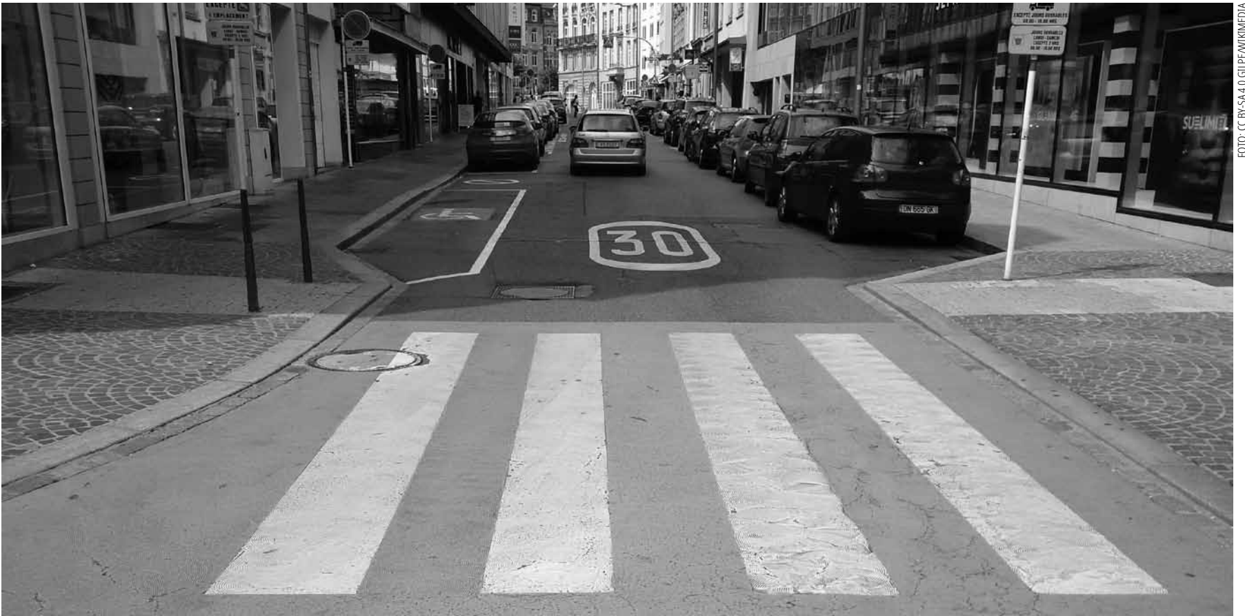
Mit Zebrastreifen in Luxemburg-Stadt fing der Kampf von Zug gegen die Gemeinde an. Am Ende ging es aber um Transparenz und deren Verhinderung.