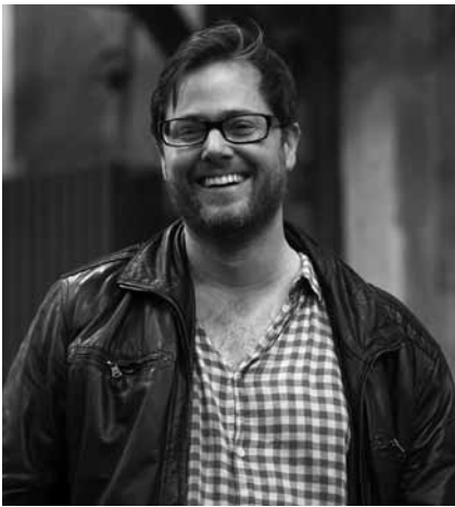
Milo Rau ist für seine Arbeit an der Schnittstelle von Kunst und Aktivismus bekannt. Seit 2024 ist er Intendant der Wiener Festwochen.