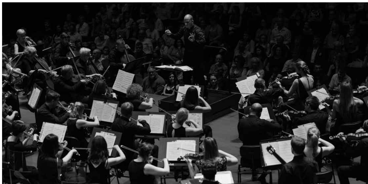
L'Orchestre de la place de l'Europe se produira au Trifolion le dimanche 25 janvier à 17 h.

Der Sandmann , visuelles Konzert, mit Texten von E.T.A. Hoffmann, mit