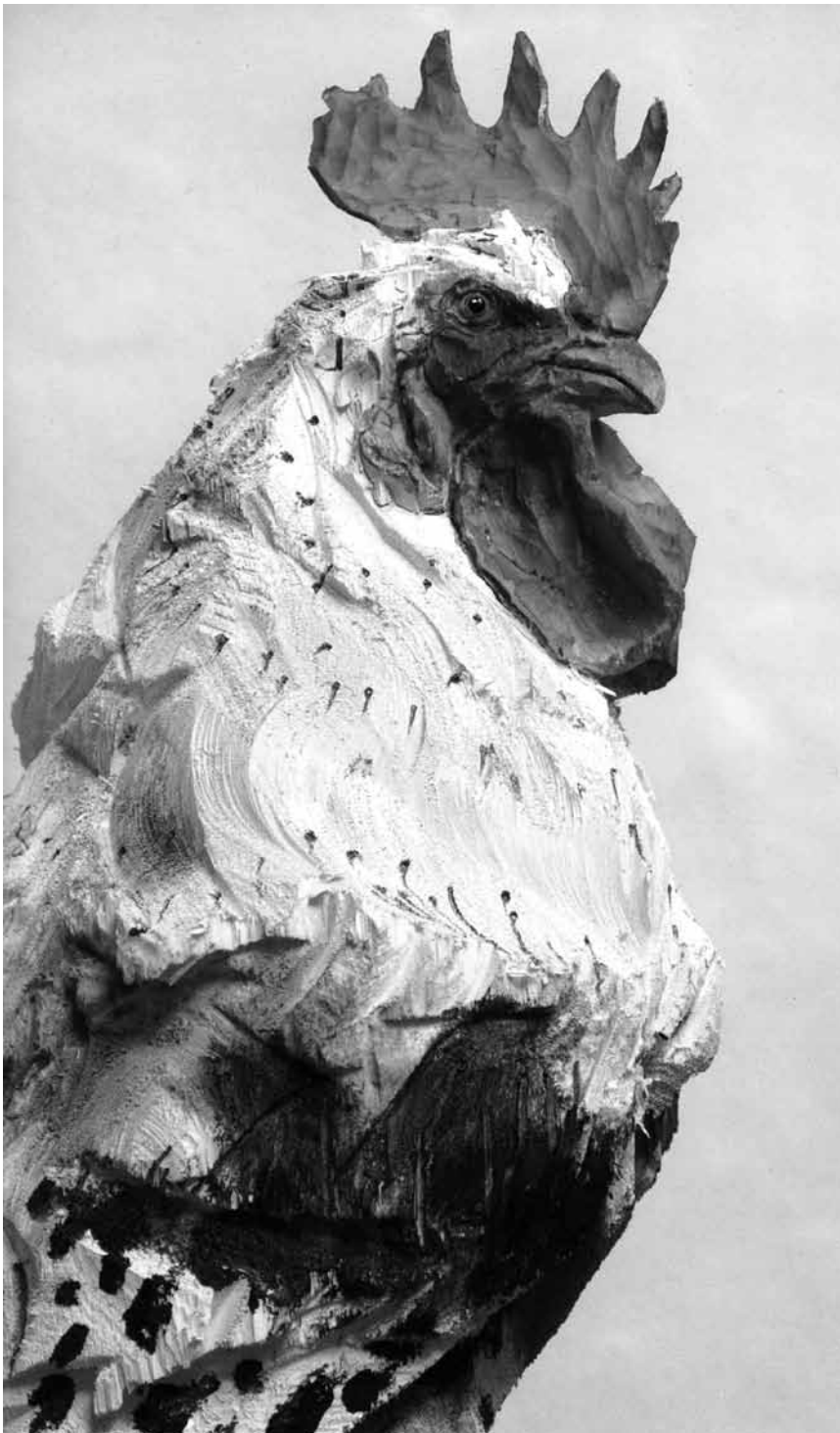
Motorsägenockel, frisch geschnitten ...

Orienté Objekt" oder Kira O'Reilly den Beziehungen von Tier und Mensch - über das Phänomen Haut - auf neue Weise zu nähern versuchte.