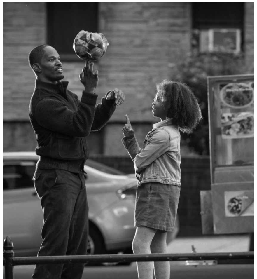
„Annie“ - oder das hässliche Entlein revisited als amerikanisches Weihnachtsmärchen, neu im Ariston, Ciné Waasserhaus und Kursaal.