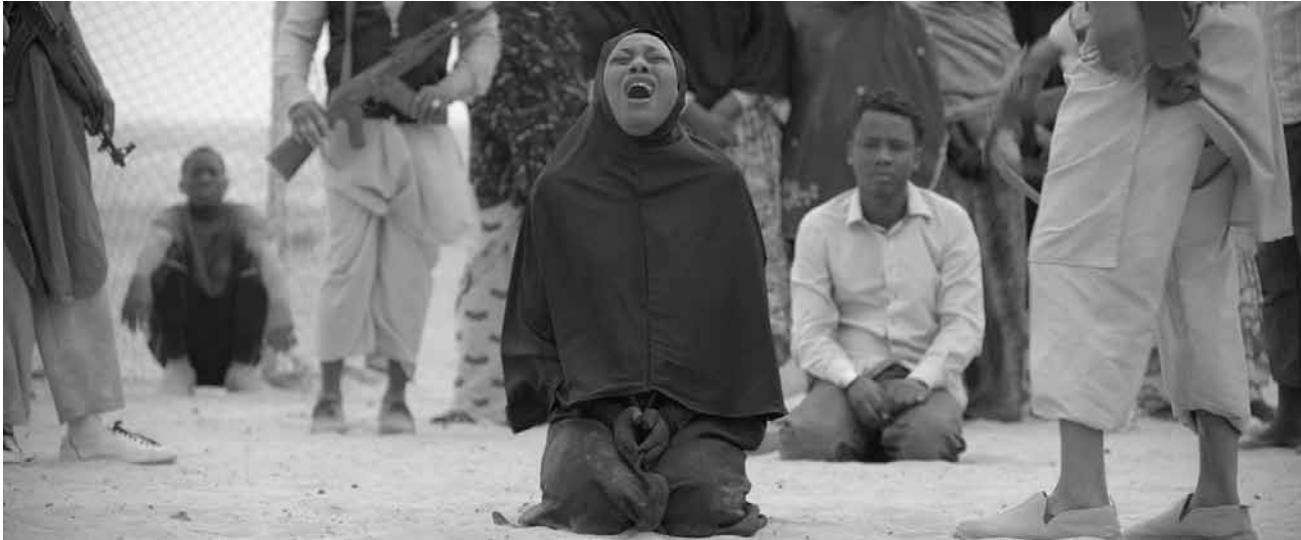
Face à la barbarie, la population locale résiste - ne serait-ce qu'en chantant en recevant des coups de fouet, punition pour avoir... chanté.