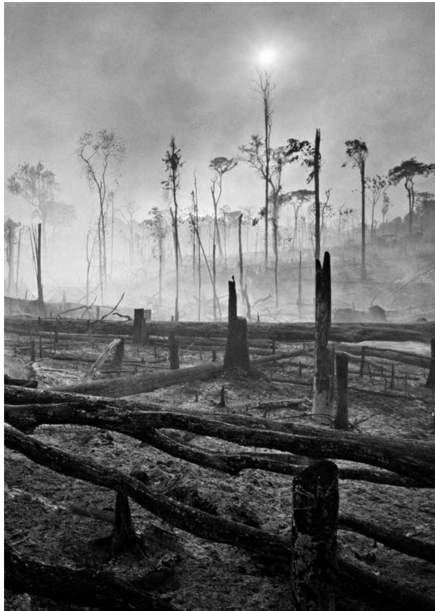
Fotos von Hans-Jürgen Burkard zeigt das Historische Museum Saar vom 26. Juni bis zum 9. Oktober.

NEW 1ère rencontre internationale d'art contemporain miniature, Maison Koch et Musée du vin (place de l'Europe, 2, Hemmeberreg et 115, rte du vin à Ehnen), du 2.7 au 4.9, tous les jours 14h - 18h (maison Koch) et ma. - di. 9h30 - 11h30 + 14h - 17h (Musée du vin).