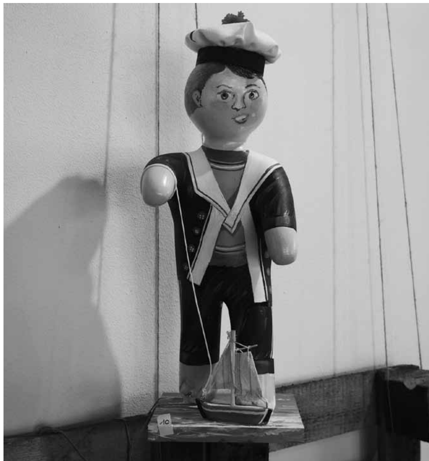
Das Espace Beau Site in Arlon lässt die Puppen tanzen: „K-Dolls“ - noch bis diesen Sonntag, dem 26. Juni.