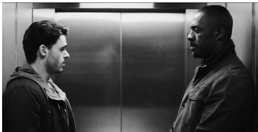
Aktivisten, Bomben, Paris ... „Bastille Day“ war wohl im vergangenen November schon abgedreht. Neu im Utopolis Kirchberg.