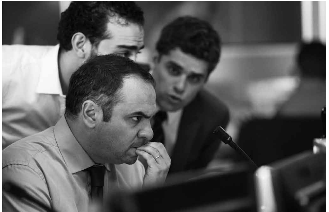
La Société générale ne vous encourage pas à aller voir « L'Outsider », l'histoire du trader Jérôme Kerviel. Nouveau à l'Utopolis Kirchberg.

Jérôme est né en 1977 dans une banale bourgade de pêcheurs du Finistère. Adolescent sans histoire, il mène une vie ordinaire avec son frère et ses parents, un couple uni et travailleur. Il suivra des études convenables qui le mèneront à un DESS de finance. Il est recruté en 2000 par la Société générale où on l'affecte au « middle office », sorte de secrétariat chargé de comptabiliser les ordres passés par les prestigieux traders qui officient dans la mythique salle des marchés, considérée à l'époque comme la meilleure au monde sur les produits financiers dérivés.