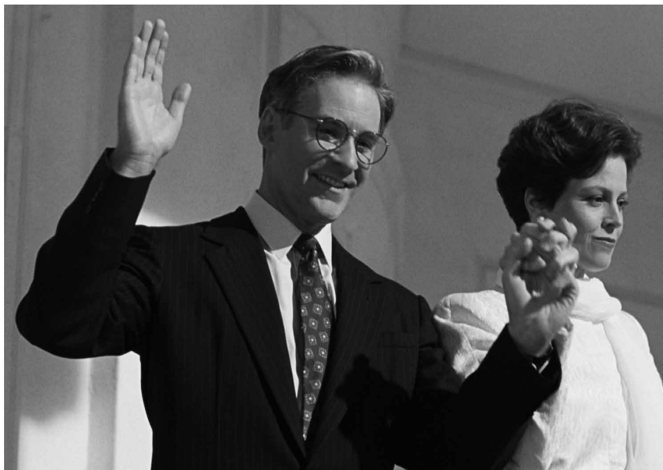
Un sosie du président des States rencontre de vrais problèmes : « Dave », vendredi à la Cinémathèque.

Walter Burns, rédacteur en chef d'un quotidien, envoie sa femme Hildy, qui souhaite divorcer, effectuer un reportage insensé : interviewer un condamné à mort. En fait, il multiplie les stratagèmes pour la récupérer.