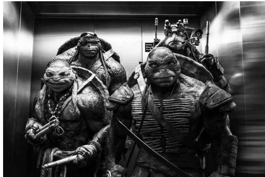
Schildkrötensuppe, scharf gewürzt : In „Ninja Turtles 2“ retten die Mutanten mal wieder die Welt - neu im Utopolis Kirchberg und Belval.

Aimeriez-vous retourner vivre chez vos parents ? À 40 ans, Stéphanie est contrainte de retourner vivre