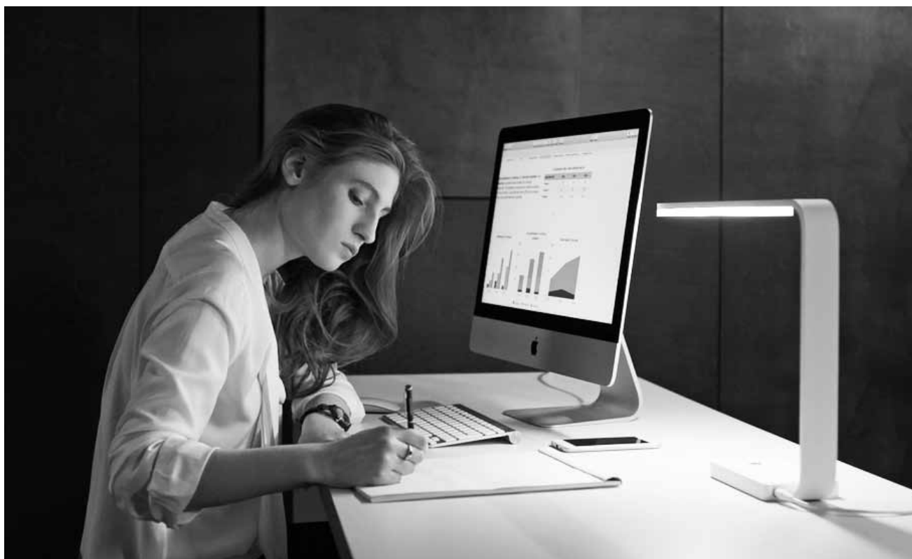
Les liaisons dangereuses rencontrent la haute finance : « Tout de suite maintenant » - nouveau à l'Utopia.

dans la haute finance. Quand elle apprend que son patron et sa femme ont fréquenté son père dans leur jeunesse, elle découvre qu'une mystérieuse rivalité les oppose encore. Ambitieuse, Nora gagne vite la confiance de ses supérieurs mais entretient des rapports compliqués avec son collègue Xavier, contrairement à sa sœur Maya qui succombe rapidement à ses charmes.