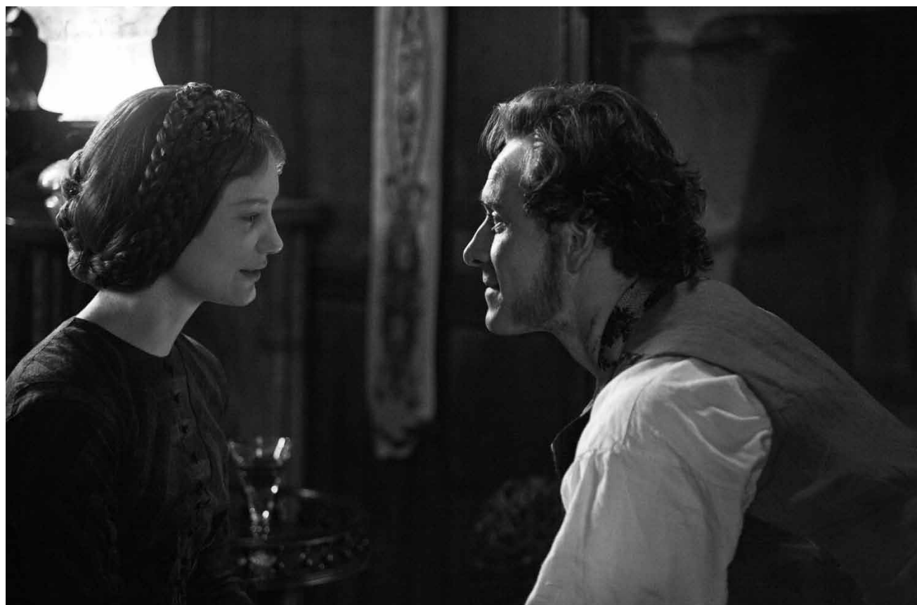
Der Klassiker von Emily Brontë in seinem letzten Gewand: „Jane Eyre“, am 1. April in der Cinémathèque.

Un joueur de football meurt dans un accident. Pourtant, à l'arrivée au ciel, les « contrôleurs » s'aperçoivent qu'il n'aurait pas dû mourir. Il lui faudra donc se réincarner.