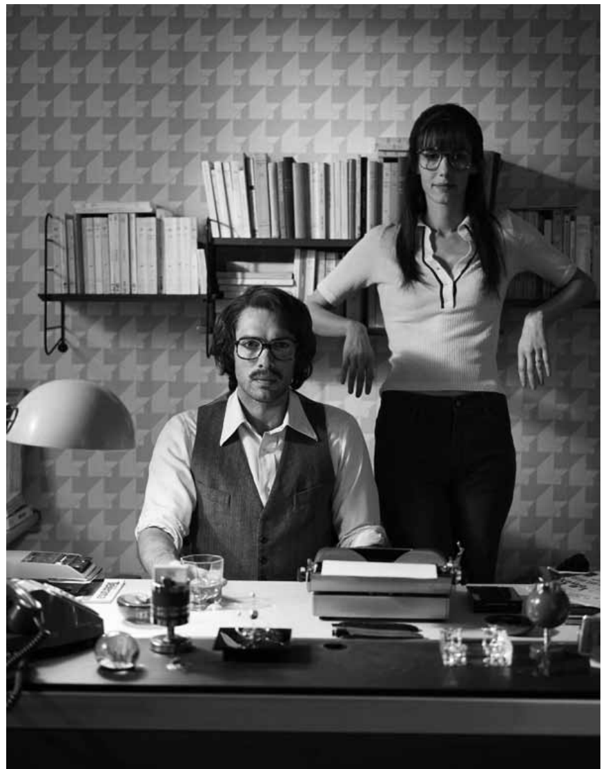
Chez « Monsieur et madame Adelman », l'heure est à la comptabilité après plus de 45 ans de vie commune - Ciné breakfast à l'Utopia.