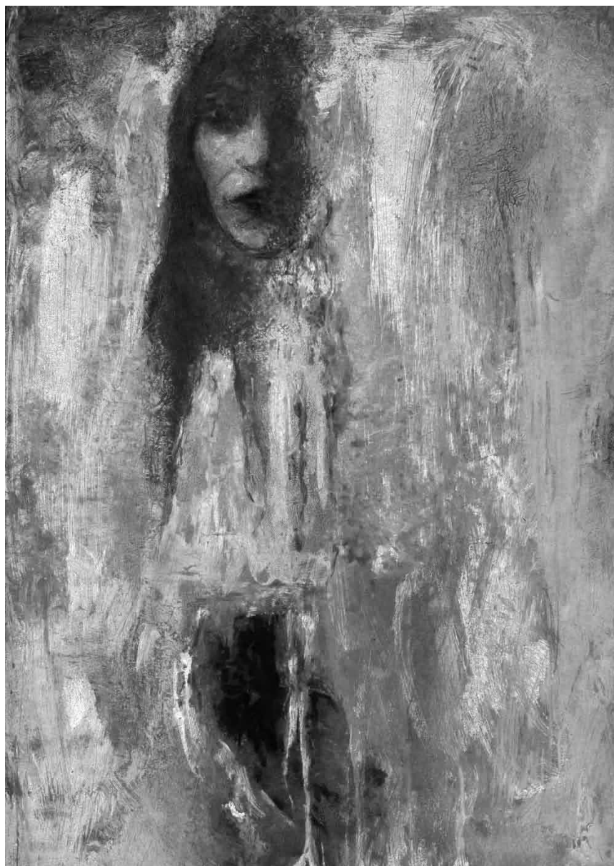
Robi Gottlieb-Cahens Frauenporträts spiegeln oft Leiden und Schmerz und geben Einblick in seine Gefühlswelt: „Ytzkor - Erinnerungen“, im Rahmen von „Judeum Epternacum“ vom 19. Februar bis zum 18. März im Trifolion.

(montée du Château. Tél. 92 96 57), Clervaux, me. - di. + jours fériés 12h - 18h. Fermé jusqu'au 28.2.