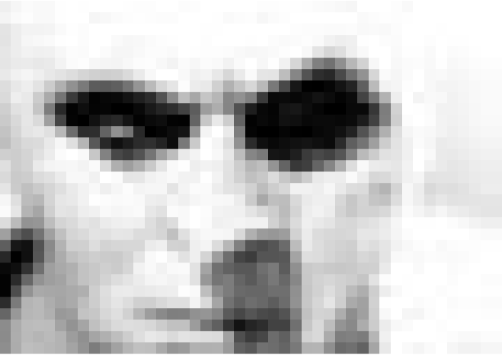
Verfällt dem Wahnsinn: Irrenanstaltsleiter Prof. Baum in "Das Testament des Dr. Mabuse", ARTE, Freitag, 23h40.