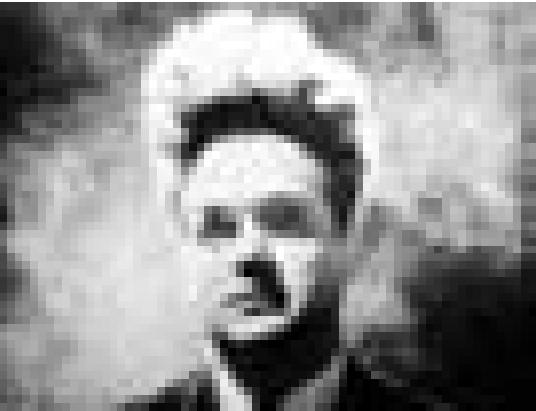
La tête de Henry Spencer (John Nance) et les particules-semence d'Eraserhead. "Eraserhead" de David Lynch à la Cinémathèque le mardi, 1.5., 20h30.

Sherlock Holmes et le Dr Watson sont appelés au château des Baskerville car des faits étranges s'y passent. L'ombre d'une malédiction ancienne plane sur le château, per-