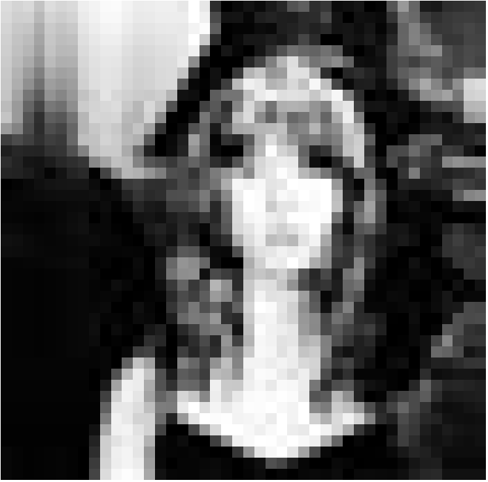
Terrifiée - un fantôme au Louvre: "Belphégor" de Jean-Paul Salomé. Nouveau à l'Utopolis (Luxembourg) et à l'Ariston (Esch/Alzette)

Vu que le jour ne lui a jamais vraiment réussi jusqu'ici, Antoine a