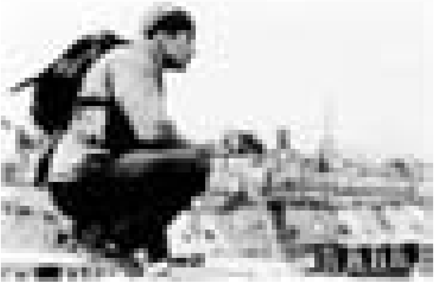
Courageux – des jeunes héros au dessus de Paris: "Yamakasi, samouraïs des temps modernes" d'Ariel Zeitoun d'après une idée de Charles Perriere et de Luc Besson. Nouveau à l'Utopolis.