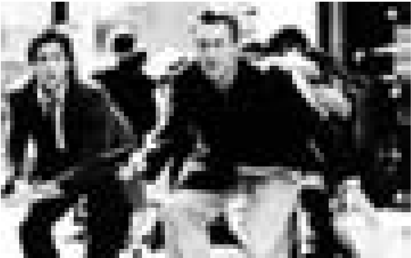
Merde! 15 minutes ce n'est pas beaucoup ... Robert De Niro dans "15 minutes" de John Herzfeld. Nouveau à l'Utopolis.