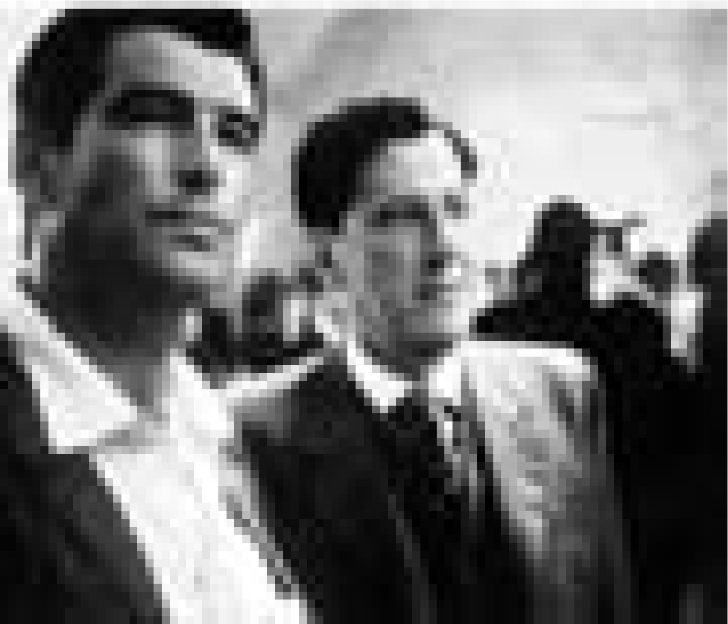
Des espions bien habillés ... "The Tailor of Panama" par John Boorman. D'après John Le Carré. Nouveau à l'Utopia.