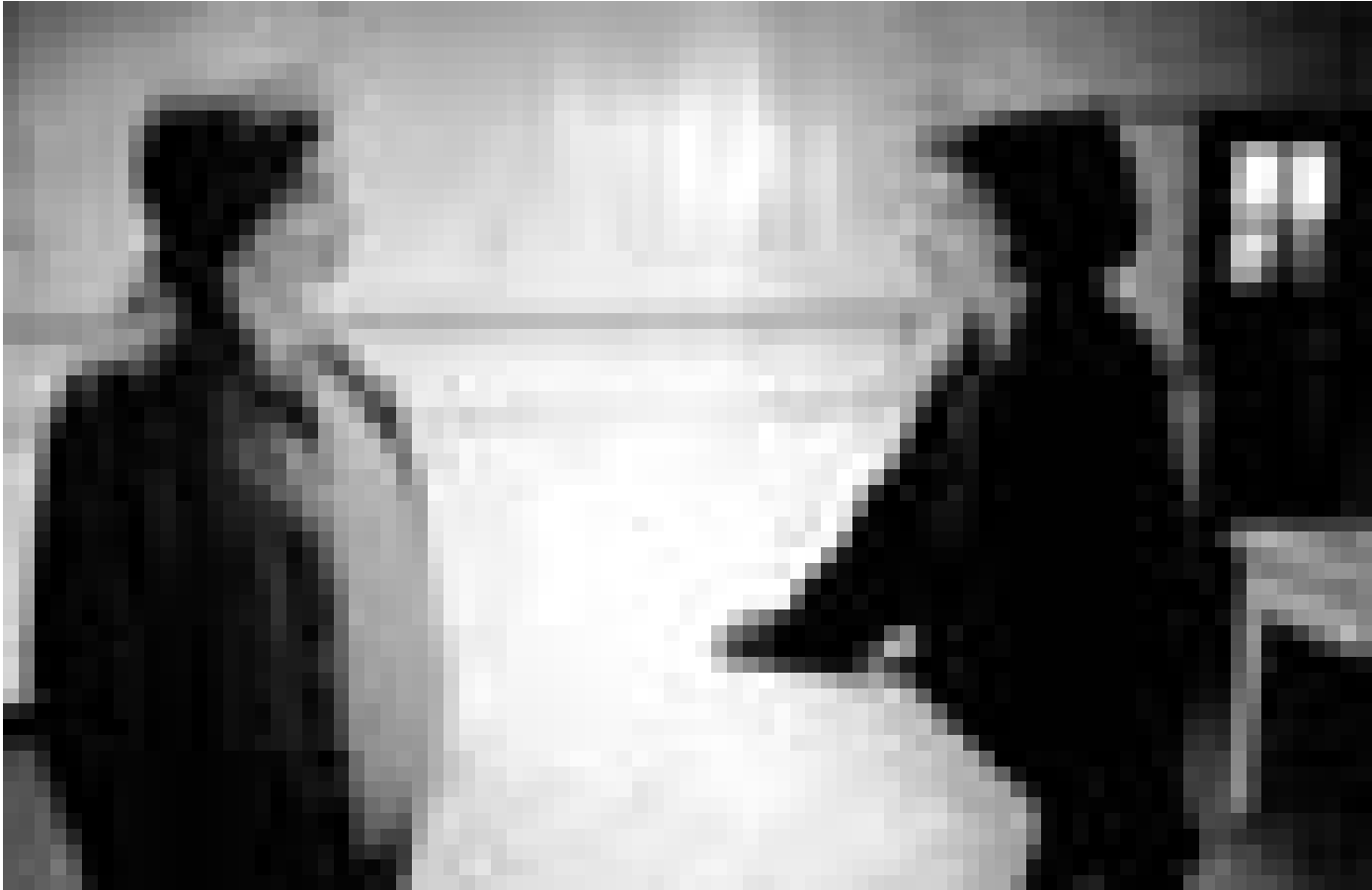
A l'Utopia dans le cadre des "Summerfolies": "Trois couleurs: Bleu" de Krzysztof Kieslowski.

Craig Schwartz est marionnettiste, mais gagne sa vie comme archiviste au 7e étage et demi d'un immeuble de bureaux. Un jour, il découvre derrière un meuble une porte qui mène au cerveau de l'acteur John Malkovich. Par après, les épisodes se bouleversent. Sa collègue de bu-reau organise des visites guidées du cerveau en question, John Malko-vich lui-même s'en mêlera, etc., etc. XXX Joyusement amoral, ce traité simpliste sur la manipulation regorge