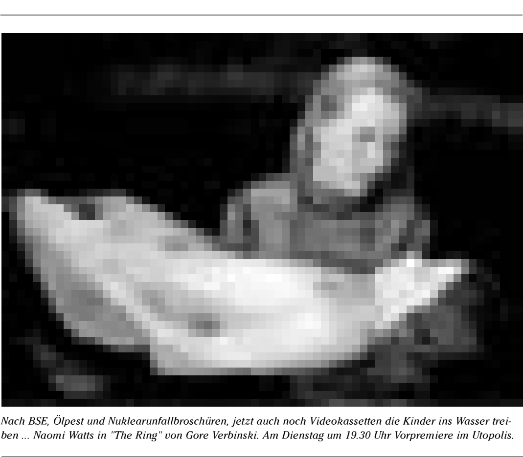
Nach BSE, Ölpest und Nuklearunfallbroschüren, jetzt auch noch Videokassetten die Kinder ins Wasser trei-ben ... Naomi Watts in "The Ring" von Gore Verbinski. Am Dienstag um 19.30 Uhr Vorpremiere im Utopolis.

USA 2002 von Jonathan Demme. Mit Mark Wahlberg, Tim Robbins u. Thandie Newton. 104'. O.-Ton, fr. + nl. U.-T.; Kinder zugelassen.