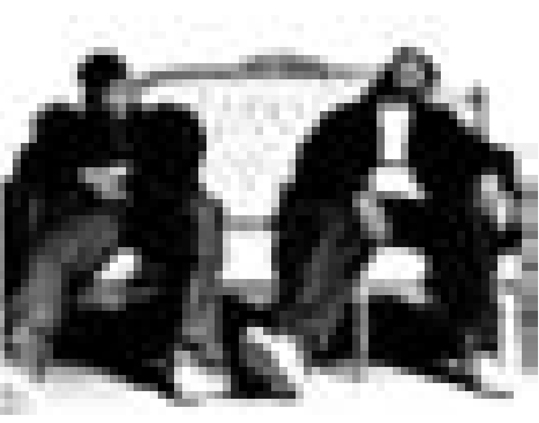
Bad boyz from NYC: DJ Premier und Guru, aka "Gang Starr". Am 3. Dezember im Atelier.