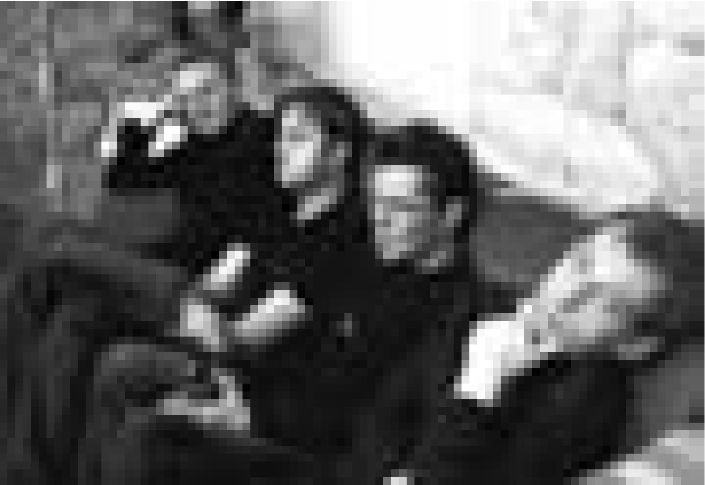
Folk-rock de l'Espace: "The Astronoïds" atterrissent au "Plain Vanilla", à Kockelscheuer, ce samedi 29 novembre à 21 heures.

Der kleine Häwelmann , Handpuppenspiel mit Gudrun