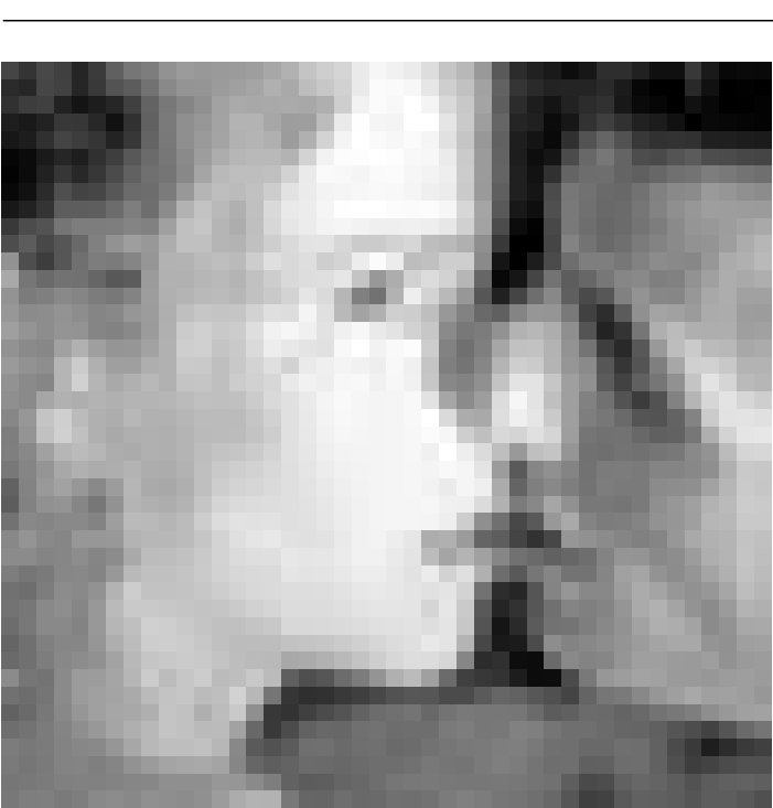
Nicole Kidman et Tom Cruise dans "Eyes Wide Shut" le dernier film réalisé par Stanley Kubrick. Mardi à la Cinémathèque.

Carlo Levi, artiste peintre et intellectuel, est relégué par décision politique dans un petit village de Lucanie en raison de son opposition au régime fasciste. Il y fait le terrible apprentissage d'une société rurale qui ne semble pas avoir été touchée par la culture et le progrès. L'apolitisme des paysans qui ne sont pas fascistes (comme ils ne seraient d'aucun autre parti) bouleverse Carlo Levi. Cet environnement n'a rien à voir avec l'état et le gouvernement centralisé de Rome.