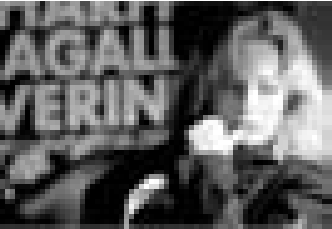
Bekam letztes Jahr die Goldene Palme in Cannes für den besten Debütfilm. "Reconstruction" von Christoffer Boe. Im Utopia im Rahmen des "Cycle de films nordiques".