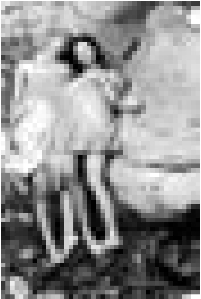
L'amour change au fil des saisons dans "Printemps, été, automne, hiver...et printemps" de Kim Ki-Duk. Nouveau à l'Utopia.

Mariés depuis peu, Ben et Alex croient avoir trouvé l'appartement idéal. Il y a bien Mrs. Connelly, une Irlandaise qui habite le logement subventionné au-dessus, mais son âge vénérable et sa santé chancelante laissent croire qu'elle quittera les lieux à la fin de son bail.