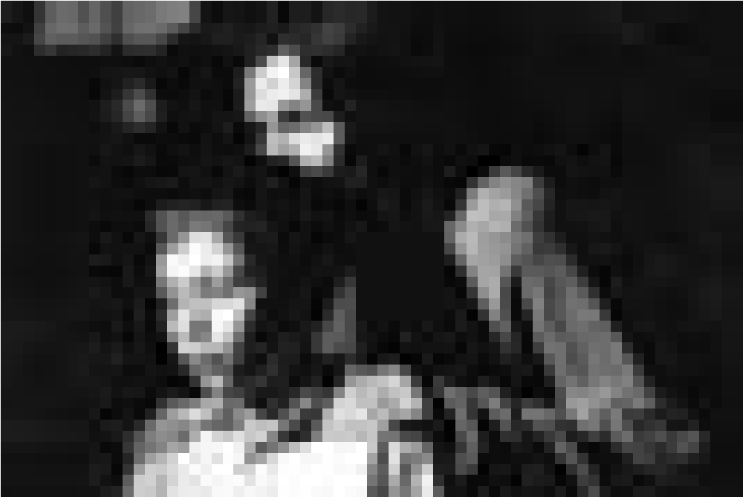
Une jeune femme se retrouve prisonnière d'un espace entre la vie et la mort. "Kiss of Death" à l'Utopia dans le cadre du "Cinédit".