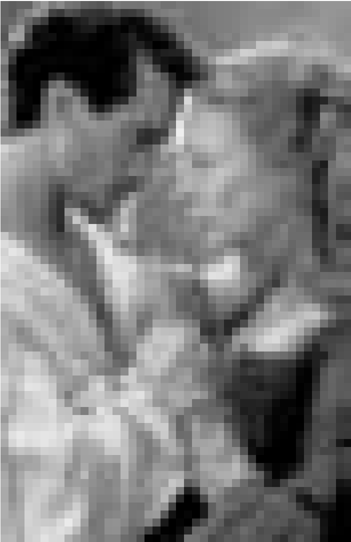
Robert Dudley (Joseph Fiennes) und seine Virgin Queen Elizabeth I (Cate Blanchett) in "Elisabeth" von Shekar Kapur. Am Mittwoch in der Cinémathèque.