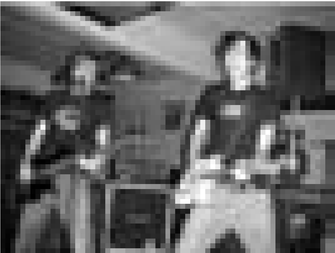
Die vielbeschäftigten Newcomer von Eternal Tango sind am Freitag, dem 1. Oktober ab 21h im 911 in Belvaux zu hören und am Samstag, dem 2. Oktober beim Sonic Faces Festival in der Kufa.