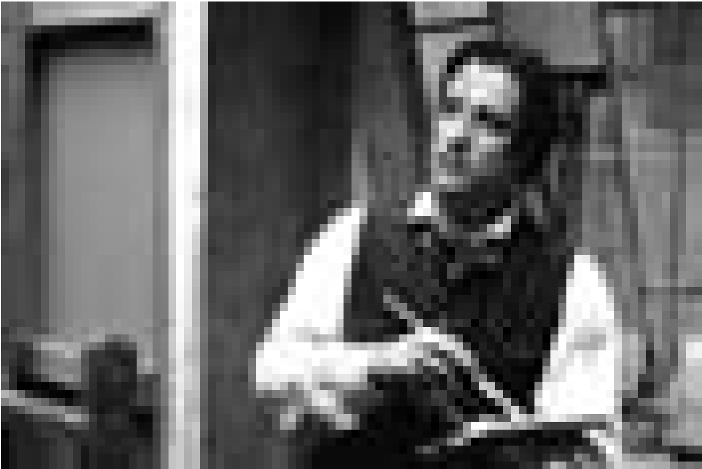
Modigliani peint: Andy Garcia interprète l'artiste dans "Modigliani" de Mick Davis. Nouveau à l'Utopia.