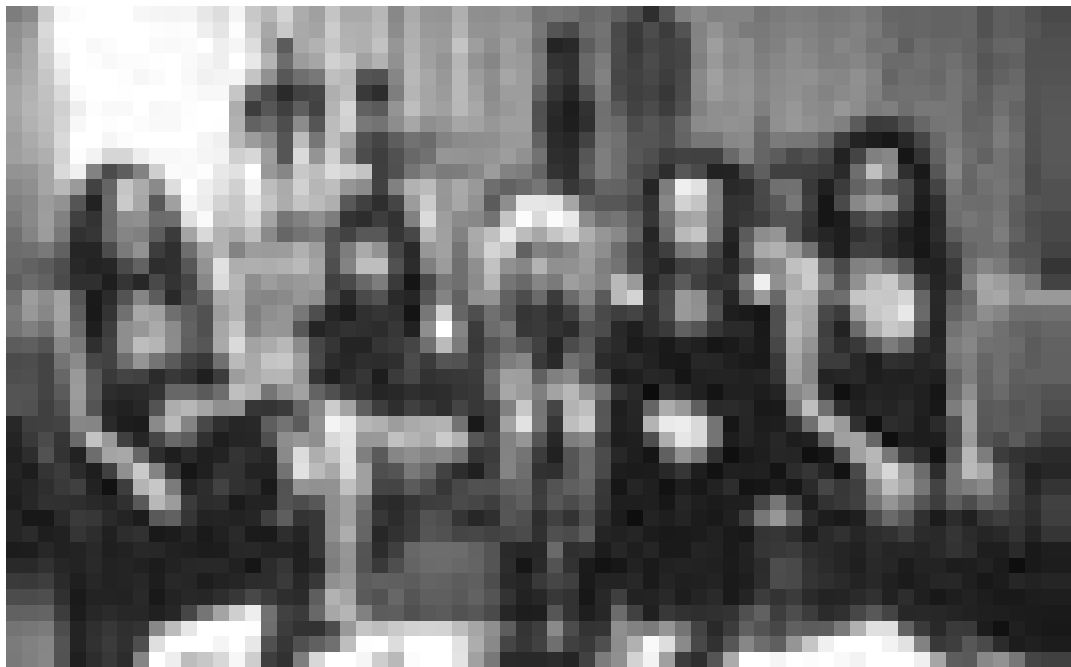
A la recherche du donneur de sperme idéal ... "She Hate Me", nouveau à l'Utopia.