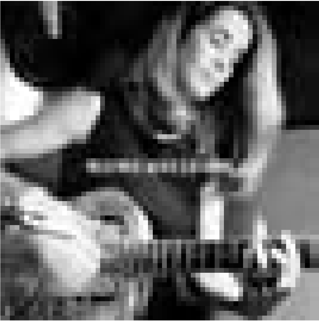
Heather Nova présentera son nouvel album de folk-rock "Storm" à l'Atelier, le samedi 4 octobre.

Der Gladiator Valerius , szenische Darstellung eines Gladiatoren-lebens, Erlebnisführung, Amphitheater (Olewiger Straße), Trier, 18h . Tel. 0049 651 7 30 10.