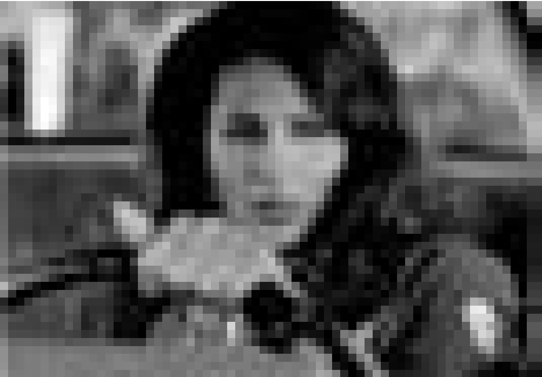
Jackie Brown, hôtesse de l'air mal payée, doit arrondir ses fins de mois ... Pam Grier dans "Jackie Brown" de Quentin Tarantino. Jeudi à la Cinémathèque.