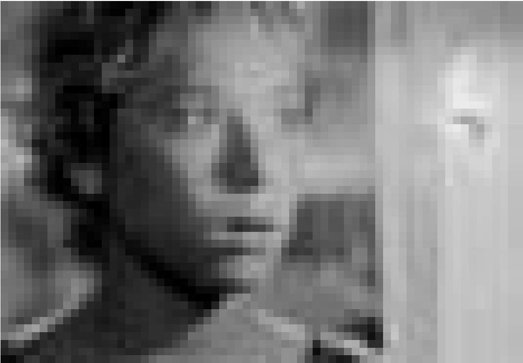
Disney revisité: Jeremy Sumpter dans "Peter Pan". Nouveau à l'Utopolis et à l'Utopia.