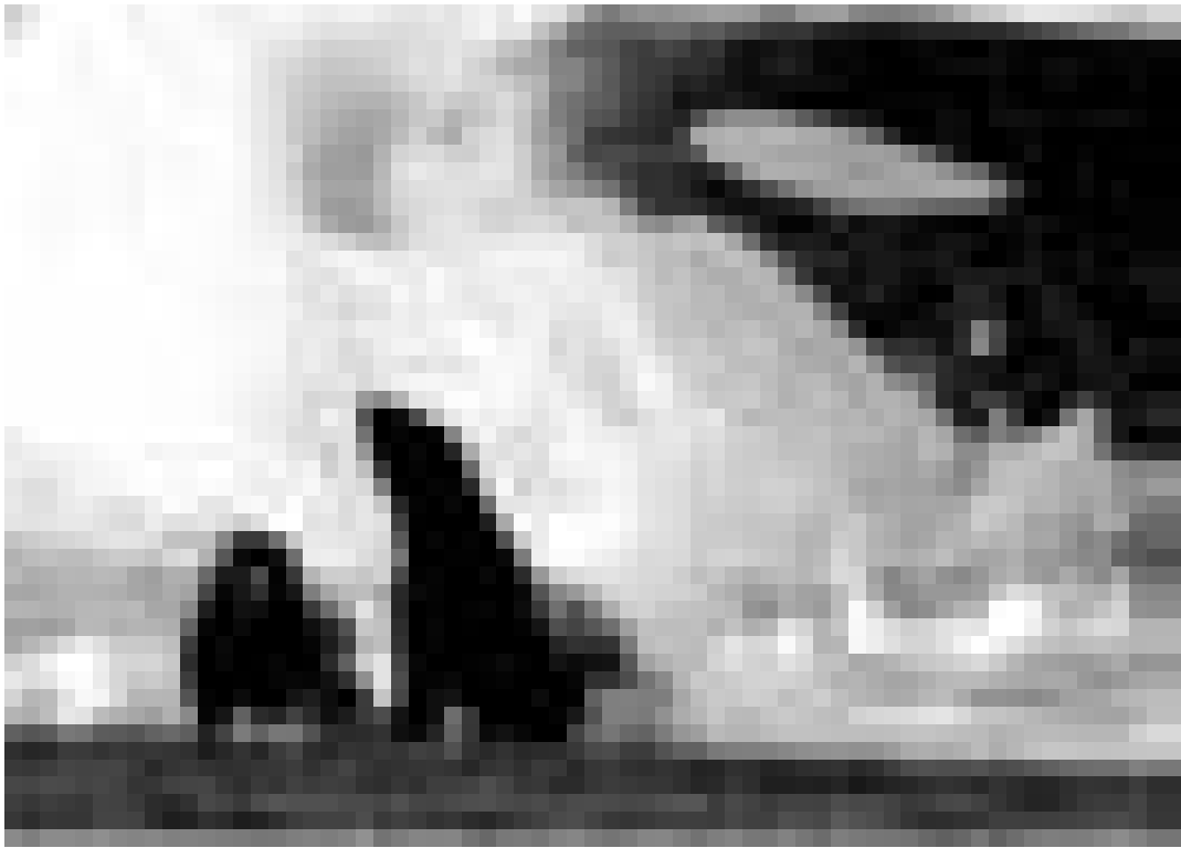
A la découverte de l'océan ... "La planète bleue". Nouveau à l'Utopia.