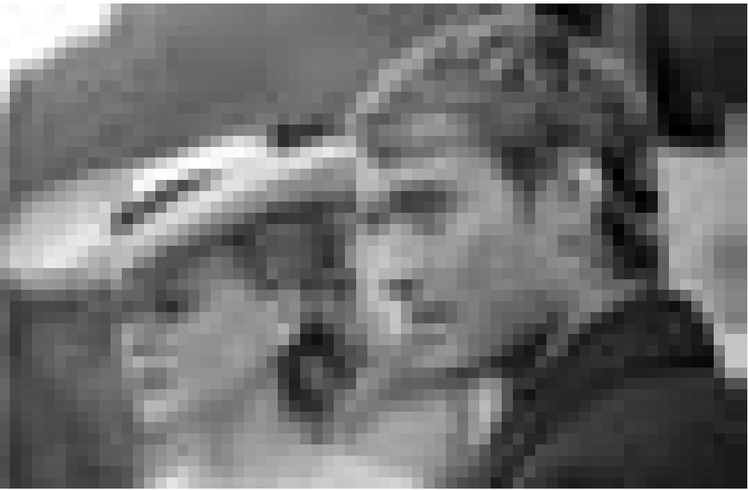
Coup de foudre: Jude Law et Nicole Kidman dans "Cold Mountain". Nouveau à l'Utopolis.