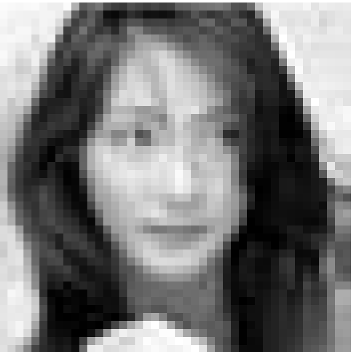
La violoniste Akiko Suwanai est l'invitée des Solistes Européens dans le cadre du Festival de Wiltz, ce samedi 30 juillet à 20h45 dans l'Amphitéâtre du Château.

Bigband Swing For Fun , Zimmerplatz (Eingang A des