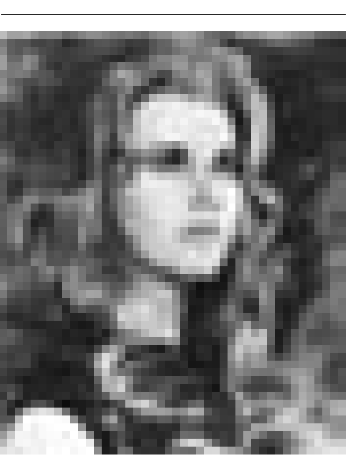
Jane Fonda en 1968 dans "Barbarella" de Roger Vadim. Samedi à la Cinémathèque.

Lun, 6.6., 18h30. USA 1984 de David Lynch. Avec Kyle Mac-Lachlan, Francesca Annis et Brad Dourif. 137'.