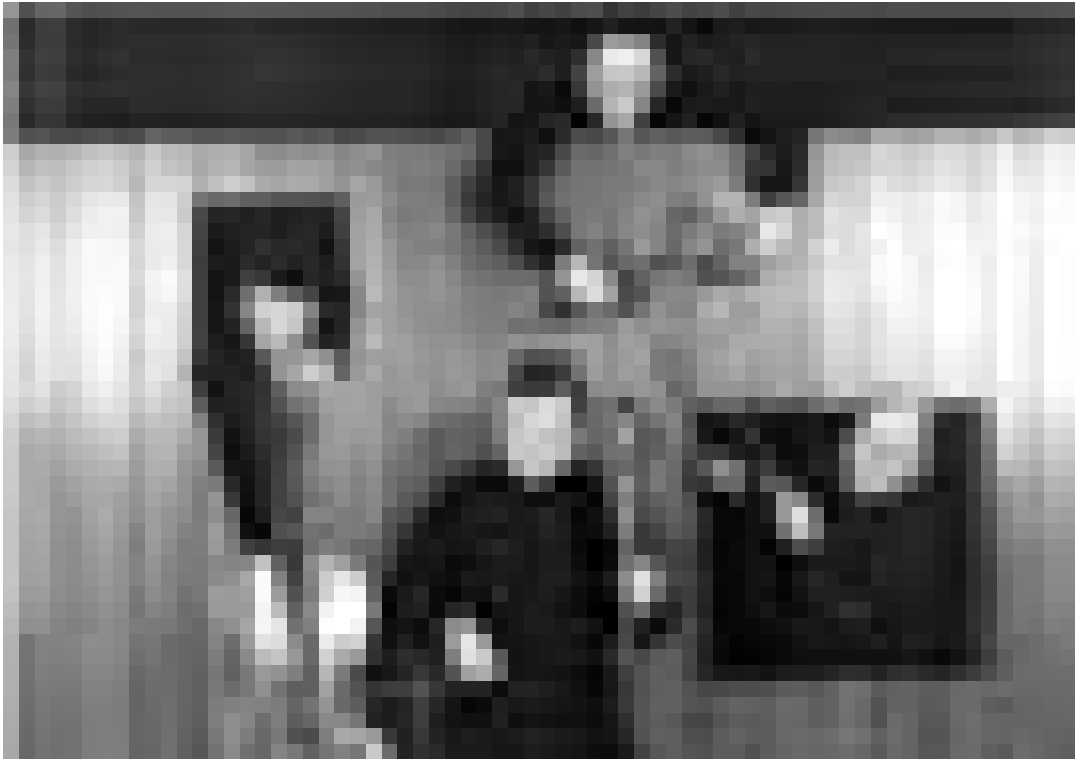
Dans le cadre du Festival d'Echternach, le quatuor Talich se produira ce vendredi, 17 juin à 20h à l'Eglise SS. Pierre-et-Paul à Echternach.

Fête de la musique , divers endroits, à travers le Luxembourg . www.fetedelamusique.lu