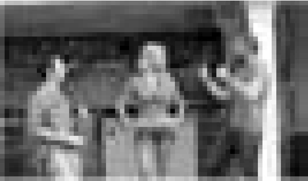
Un trio d'enfer ... Johnny Knoxville, Jessica Simpson et Sean William Scott dans "The Dukes of Hazzard". Avant-première à l'Utopolis.