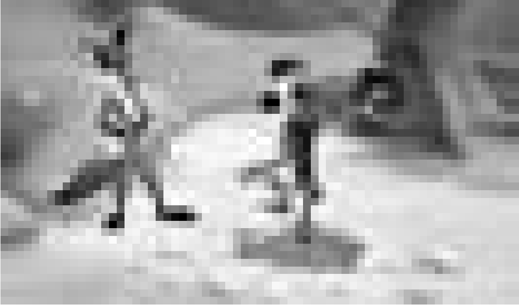
Rusé comme tous les renards, Renart dans "Le roman de Renart", film d'animation luxembourgeois de Thierry Schiel. A l'Utopia.