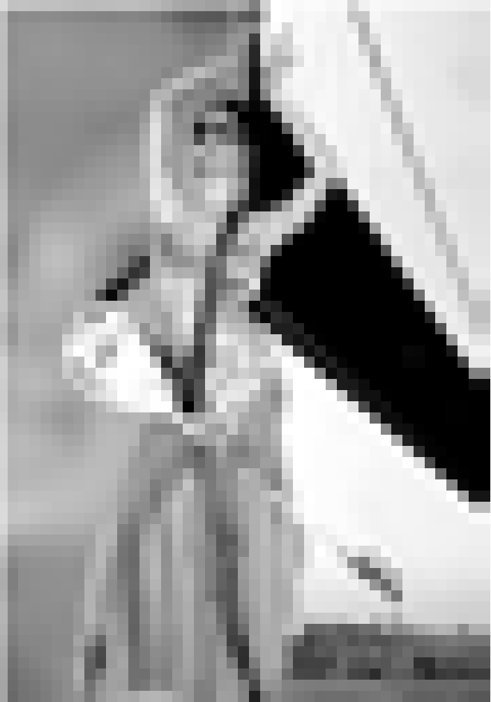
Regisseur Fatih Akin und Musiker Alexander Hacke suchen nach den kulturellen und musikalischen Hintergründen und Einflüssen von Istanbul. "Crossing the Bridge", Sondervorstellung im Rahmen der "Semaine européenne du patrimoine des migrations" am Donnerstag im Utopia.