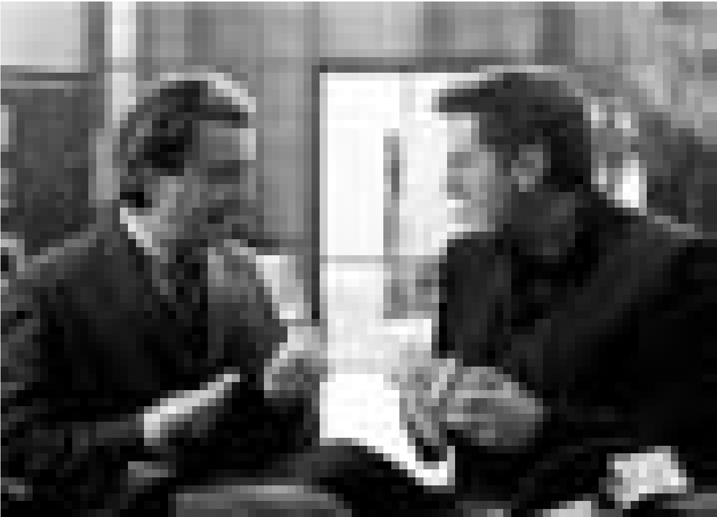
Arnaqueurs associés ... Christian Clavier et Daniel Auteuil dans "L'entente cordiale" de Vincent de Brus. Nouveau à l'Utopolis.