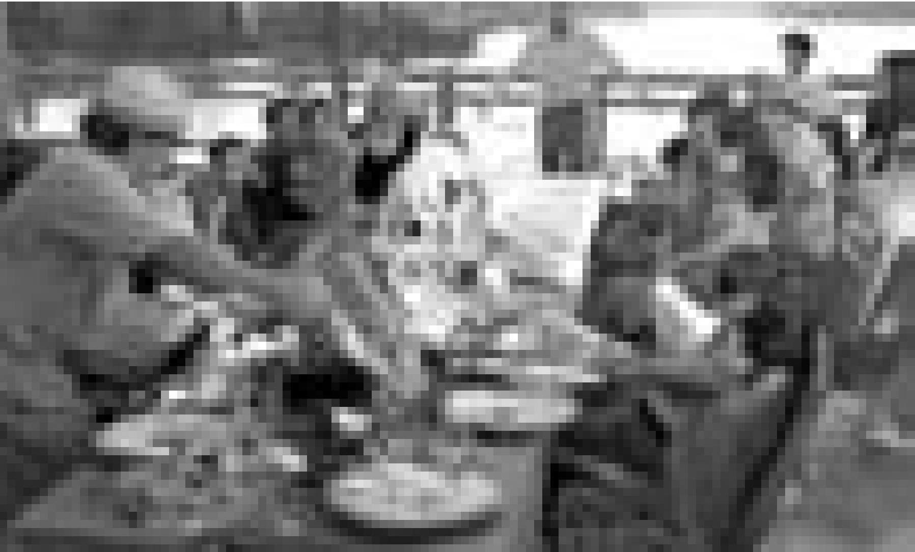
Harmonisches Ferienglück im trauten Kreis der Großfamilie. "Cheaper by the Dozen 2" von Adam Shankman. Neu im Utopolis (Luxemburg), im Le Paris (Bettembourg) und im Ariston (Esch/Alzette).

gerät in die Fänge von Capitaine Bezu Fache. Mit Hilfe von Sophie Neveu, der Enkelin des ermorde-ten Direktors des Louvre, gelingt Langdon die Flucht - vor der Polizei und anderen finsternen Mächten ... Nach dem Bestseller von Dan Brown.