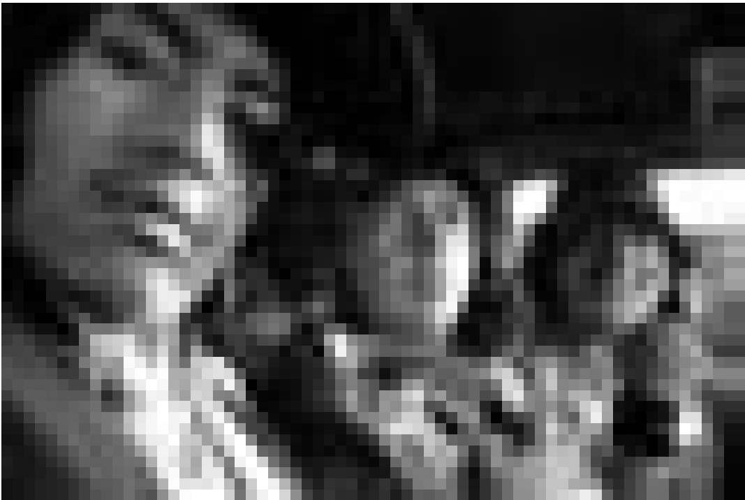
En route pour la pagaille: les Wassup Rockers sur le point de franchir les barrières entre South Central et Beverly Hills.