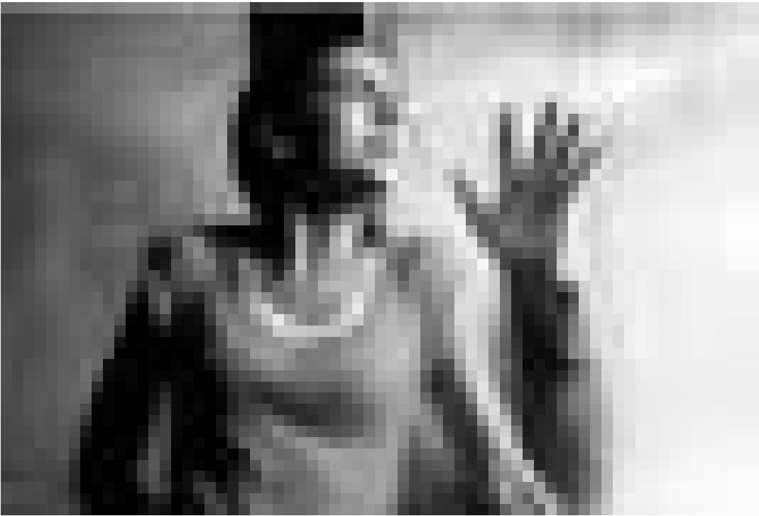
Harcelée pendant le "babysitting". Camilla Belle dans "When a Stranger calls" de Simon West. Nouveau à l'Utopolis.

USA 2005, Musikfilm von John Turturro. Mit James Gandolfini, Susan Sarandon und Kate Winslet. 115'. O.-Ton, fr. Ut.; ab 14.