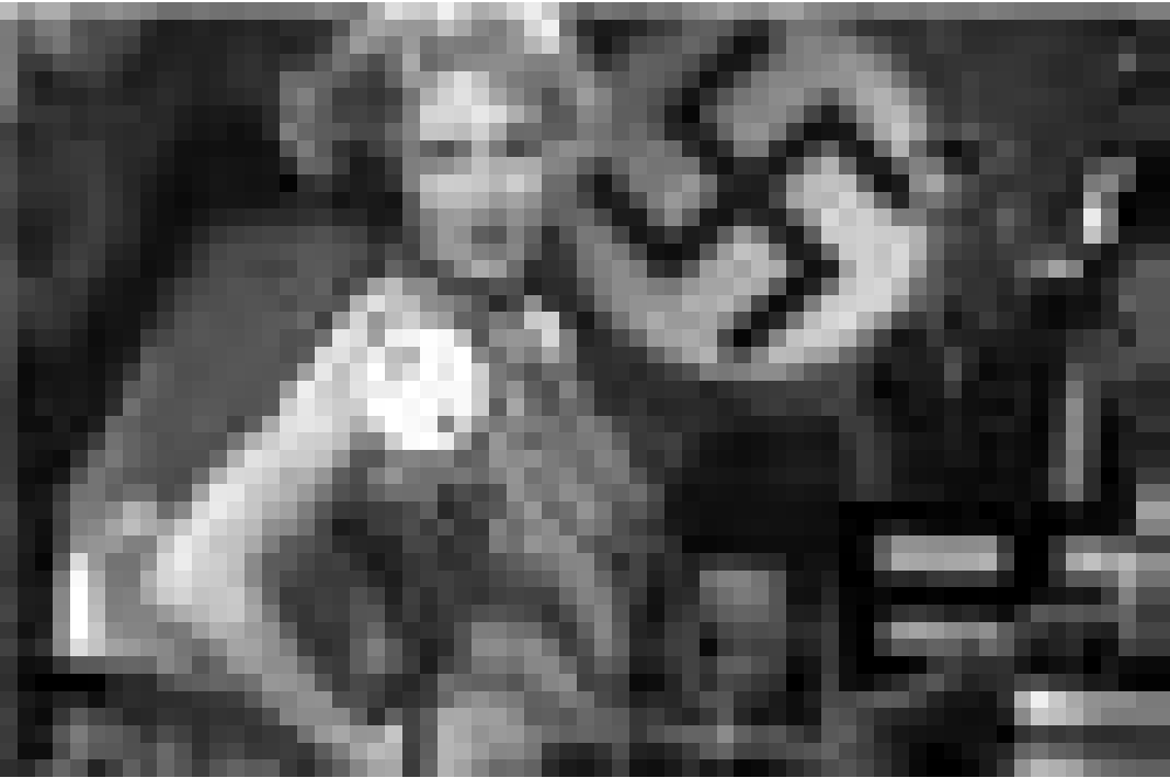
Rachel Stein alias Ellis de Vries a infiltré le service de renseignements allemand ... Carice Van Houten dans "Black Book" de Paul Verhoeven. Nouveau à l'Utopolis.