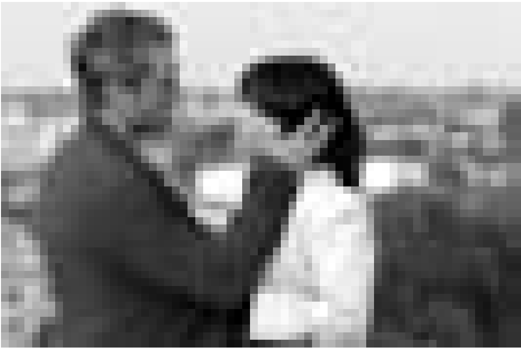
Liebe auf den ersten Blick ... Jude Law und Juliette Binoche in "Breaking and Entering" von Antony Minghella. Neu im Utopia.