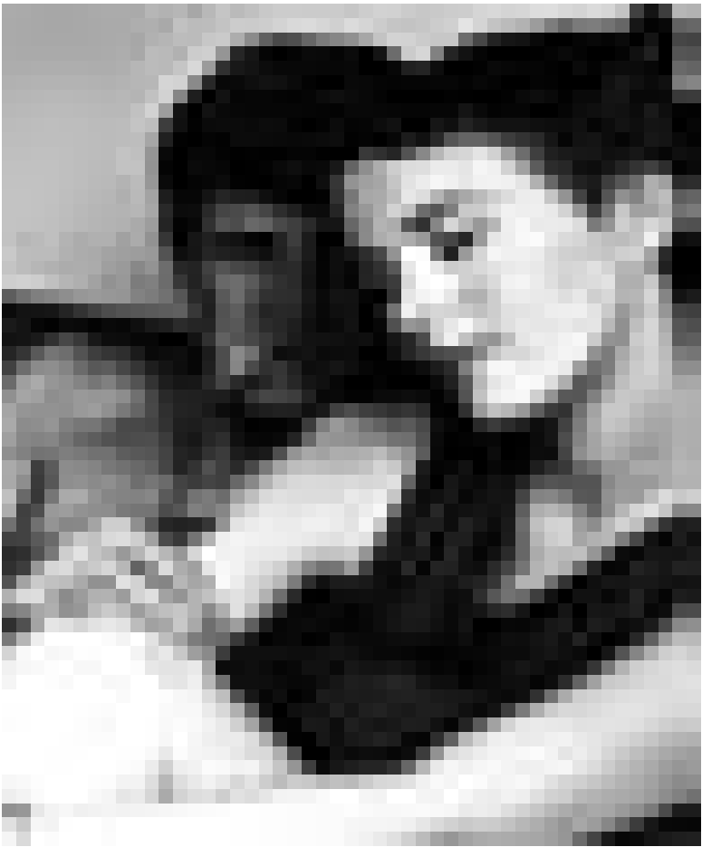
Un film qui a créé beaucoup de vagues, celle qu'on appelle la "nouvelle" entre autres ... "A bout de souffle" de Jean-Luc Godard, avec Jean-Paul Belmondo et Jean Seberg, mercredi à la Cinémathèque.