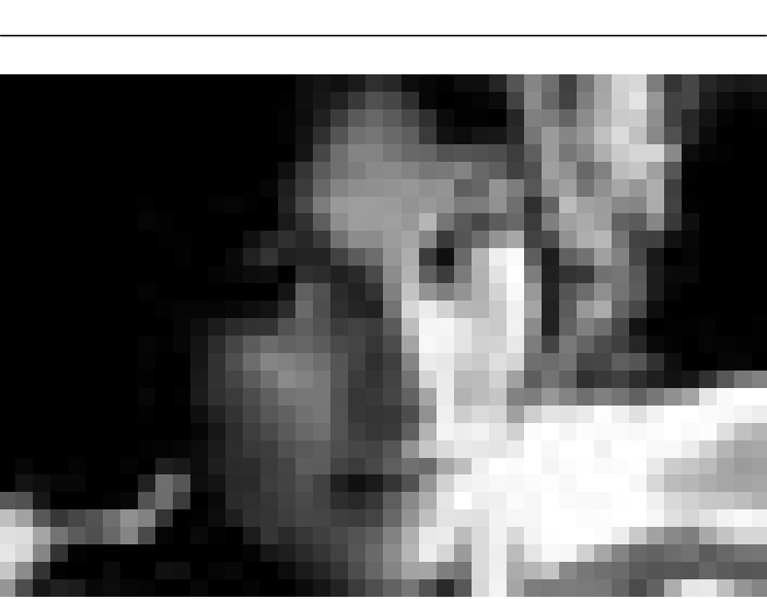
"Inside Deep Throat" Dokumentarfilm über den berühmt-berüchtigten Pornofilm aus dem Jahre 1972, mit Linda Lovelace als Hauptdarstellerin. Neu im Utopia.

GB 2005, film d'animation de Nick Park et Steve Box. 85'. Enfants admis.