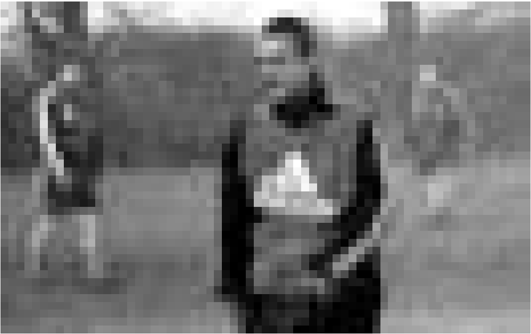
L'univers du football professionnel ... Kuno Becker dans "Goal!" de Danny Cannon. Nouveau à l'Utopolis.